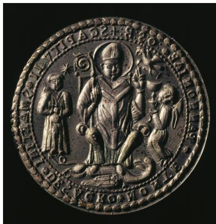
A pannonhalmi konvent hiteleshelyi pecsétnyomója

A hiteleshely olyan egyházi testület, káptalan vagy konvent, amely közhitelű pecsétjével megerősített okleveléért testületileg, kollektíven vállal felelősséget.