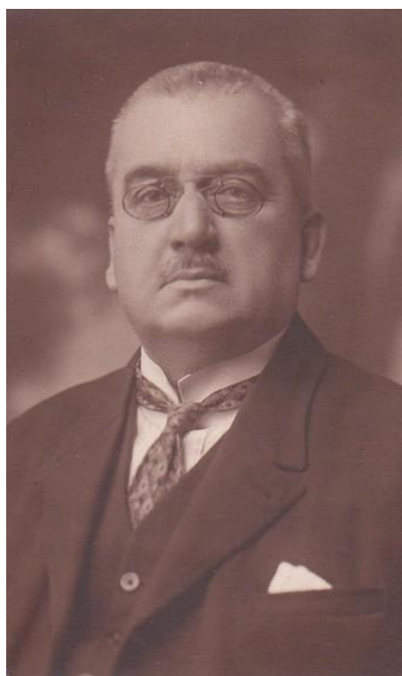
Juhász Andor, a korszak bírósági szervezetének emblematikus alakja, mivel 1925 és 1934 között töltötte be a Kúria elnökének posztját, így pedig az újonnan megalakult Kartelbíróság első elnöke is volt.