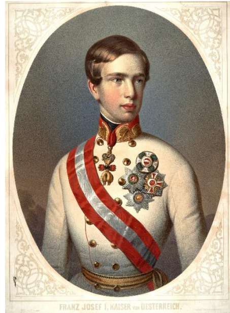
I. Ferenc József fiatalkori arcképe (Joseph Anton Bauer festménye)

A neoabszolutizmus elnevezés a korszak államformáját meghatározó nyílt uralkodói abszolutizmusból (önkényes, korlátok nélküli hatalomgyakorlás) ered. Ez a teljes Habsburg Birodalom működését meghatározta, de a Magyar Királyság területén komoly változást jelentett, hogy ennek jegyében az 1848/49. évi szabadságharc elvesztését követően a király nem hívta össze a magyar országgyűlést . Az országgyűlés működésének hiányában törvényalkotásra sem kerülhetett sor, így az uralkodó császári rendeletekkel (pátens) kormányozta az országot, amelyek tartalmára a magyar rendek csekély befolyást tudtak gyakorolni. A korszak azonban a polgári átalakulást megerősítette, ugyanis Ferenc József a törvény előtti egyenlőséget és a jobbágyfelszabadítást hatályban tartotta és annak hiányzó elemeit szabályozta.