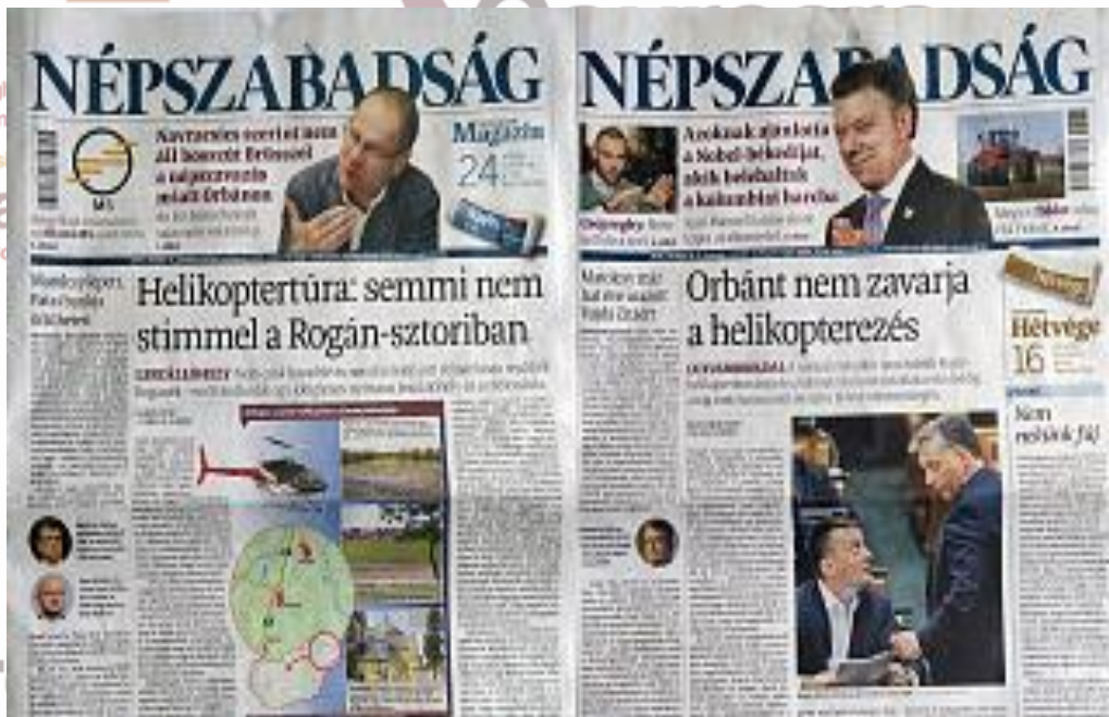
A Népszabadság megszűnésének egyik valódi oka.

2015: az MSZP Szabad Sajtó Alapítványa is megvált tulajdonrészétől.