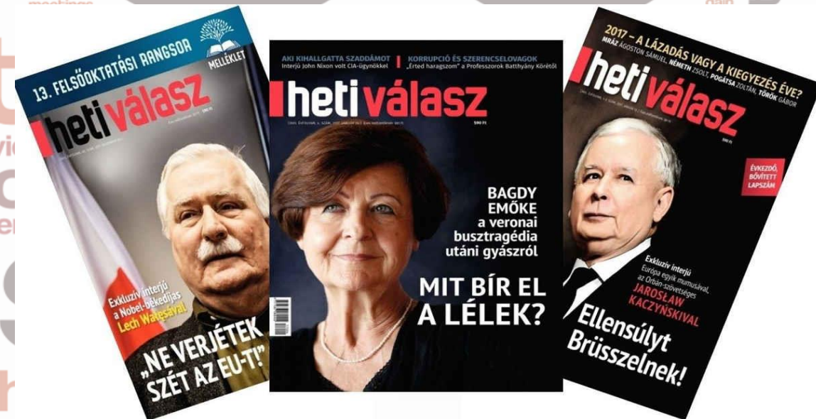
Heti Válasz címlapok.

2004-ben az újság a Sasliget Kft. tulajdonába került.