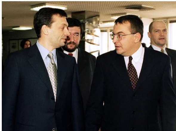
1. kép: Orbán Viktor és Simicska Lajos 1999-ben 8

„ Totálissá válhat a médiaháború, ha a kormány valóban bevezeti az RTL-lel való békülés jegyében az ötszázalékos reklámadót (...).” 7