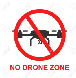
4. ábra. Példa No drone zone jelölésére piktogrammal.

Ha lakott területen kívül, olyan helyszínen szeretnénk drónozni, ahol nincs No Drone Zone, valamint teljesítettük a regisztrációs és képzési követelményeket, akkor azt – az egyéb szabályok betartása mellett - külön engedély nélkül meg lehet tenni.