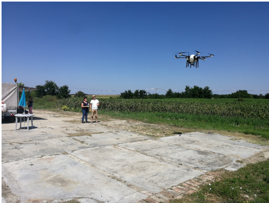
2. ábra. Drón gyakorlat – légtérhasználat

www.doe.hu/tudasbazis/hol-vannak-ilyen-legterek-hol-talalok-roluk-adatokat