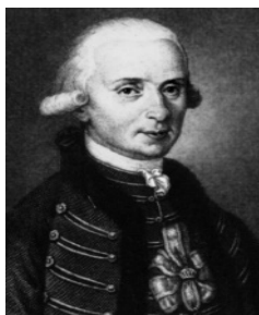
Skerlecz Miklós (1731 – 1799)

A kereskedelmi bizottság meghatározó tagja, Zágráb vármegye főispánja báró Skerlecz Miklós volt. Kiválóan képzett közgazdász volt, aki az ország gazdasági felemelkedését tartotta szem előtt.