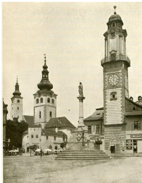
3. kép: A besztercebányai óratorony, amely település kapcsán az egyik legrégebbi szöveges emlékü nk maradt fenn ó ra működtetése kapcsán