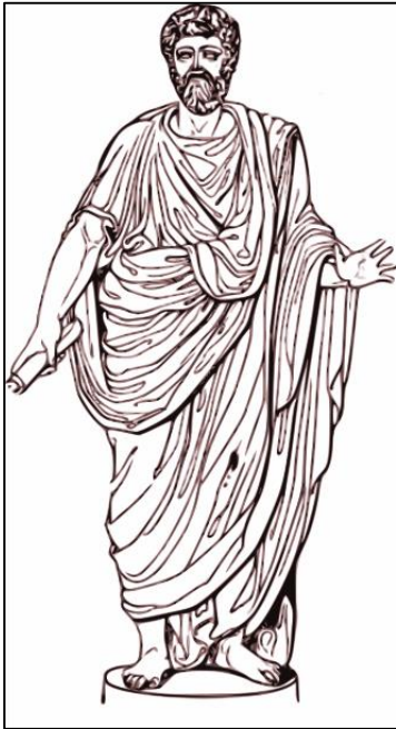
2. kép: A bonus pater familias az ókori Rómából származó alakja