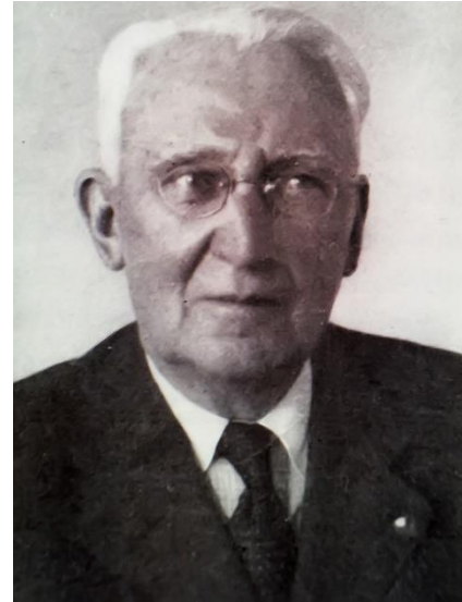
1. kép: Marton Géza, a 20. század első felének meghatározó római jog professzora, aki a felelősségtan legnagyobb magyar alakja

Szubjektív felelősség, amikor az ok-okozati kapcsolat mellett a szerződő fél akaratát, szubjektumát is figyelembe veszik. Ekkor kezdik megkülönböztetni a szándékos és a gondatlan magatartást, tehát azt, hogy a szerződő fél akaratára mire irányult.