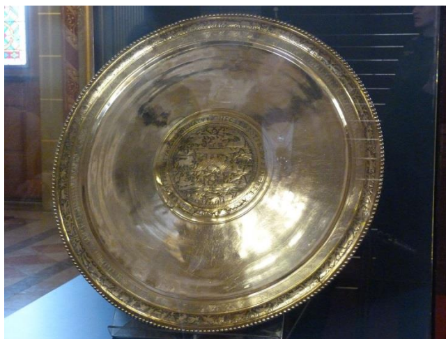
3. kép: A Seuso-kincsek egy darabja, amely a Magyarországon legnagyobb botrányt kavarázó kincslet egy eleme