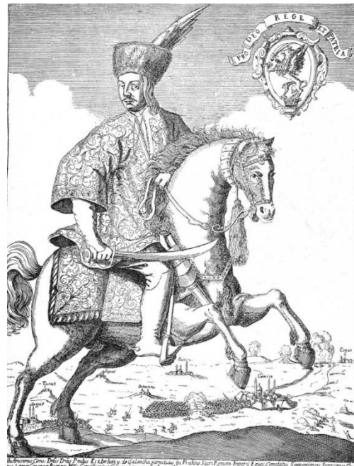
2. kép: Esterházy Pál nádor ábrázolása, akinek közrehatására fogadta el az országgyűlés a hitbizományt Magyarországon elterjesztő 1687. évi törvényt