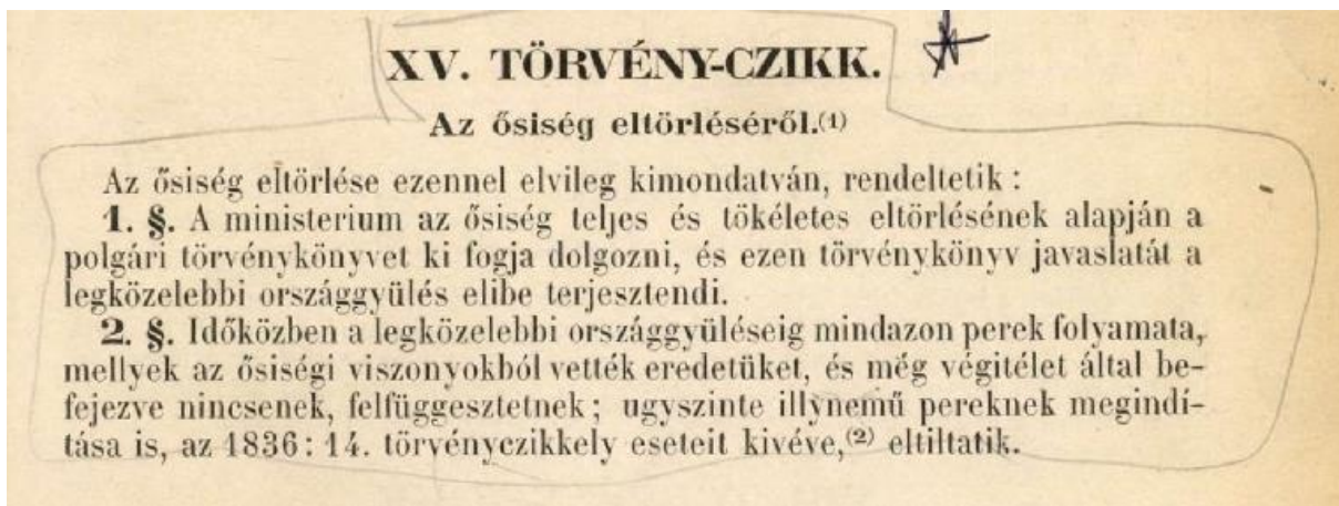
1. kép: Az ősiség megszűnését kimondó áprilisi törvény szövege a Magyar Törvénytárból

„A tulajdon szent és sérthetetlen.” – mint alapelv a tulajdon védelmét jelenti, függetlenül attól, hogy az áprilisi törvényekben ezt szó szerint nem rögzítették.