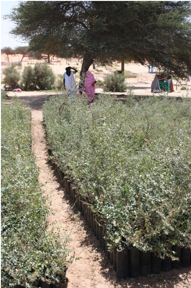
4. kép A helyiek a szaktanácsadásért "természetben" fizetnek, azaz a környékbeli erdősítési projektekhez növényanyagot nevelnek