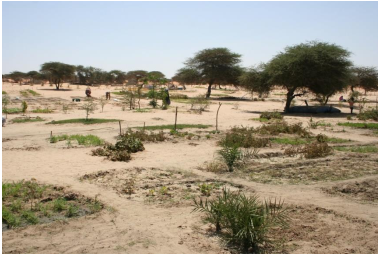
5. kép Miftah-El-Khair-nál szinte négyzetméterenként hódítják vissza a kertészeti termelésre szolgáló területet a sivatagtól

A Nouakchott-tól délre újonnan kialakított faiskolában a helyi és országos újraerdősítési programokhoz nevelik a csemetéket, szinte kizárólag őshonos fajokat (pl. arabmézgafa ( Senegalia senegal , korábban Acacia senegal ), palesztin akácia ( Vachellia raddiana , korábban Acacia tortilis subsp. raddiana )) szaporítva, a kevés nem őshonos faj gyakorlatilag csak közterület-fásítási programokat szolgál. Az első évben 690 ezer növényt neveltek, ezt a mennyiséget szeretnék évi kétmillióra növelni. Bizonyos mennyiségű gyümölcsfacsemetét (pl. mangó, gránátalma) is előállítanak, ezeket a környékbeli lakosságnak adják át térítésmentesen különböző projektek keretében. Ezzel elsősorban az élelmezésük minőségét kívánják javítani, de kiegészítő jövedelemhez is juthatnak.