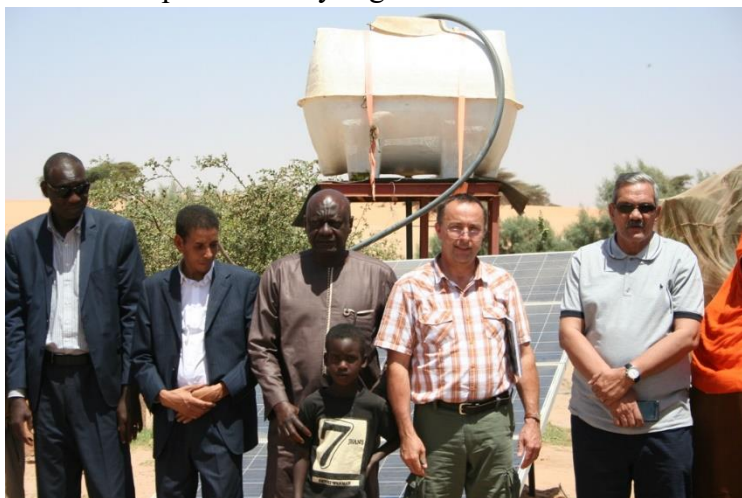
3. kép Az APMGV és a mauritániai nemzeti ügynökség munkatársaival az egyik projekt helyszínén