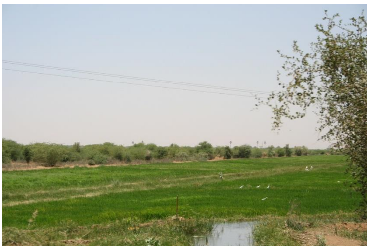
10. kép Mauritániának egyedül a délnyugati határvidéke van viszonylag szerencsés helyzetben, hiszen a Szenegál folyó vize érdemi mezőgazdasági termelést tesz lehetővé, az egyik legjelentősebb kultúra itt a rizs.

találkozók formájában. Itt szívesen látott vendégek az érkező fiatalok is.