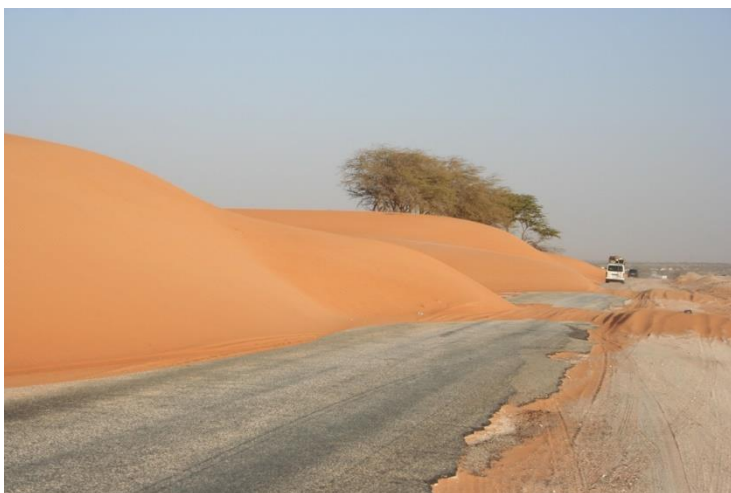
9. kép A cselekvés szükségességét mindennél jobban mutatják a lassan, de egyelőre megállíthatatlanul vándorló homokdűnék, amik mindent betemetnek, ami az útjukba kerül...

találkozók formájában. Itt szívesen látott vendégek az érkező fiatalok is.