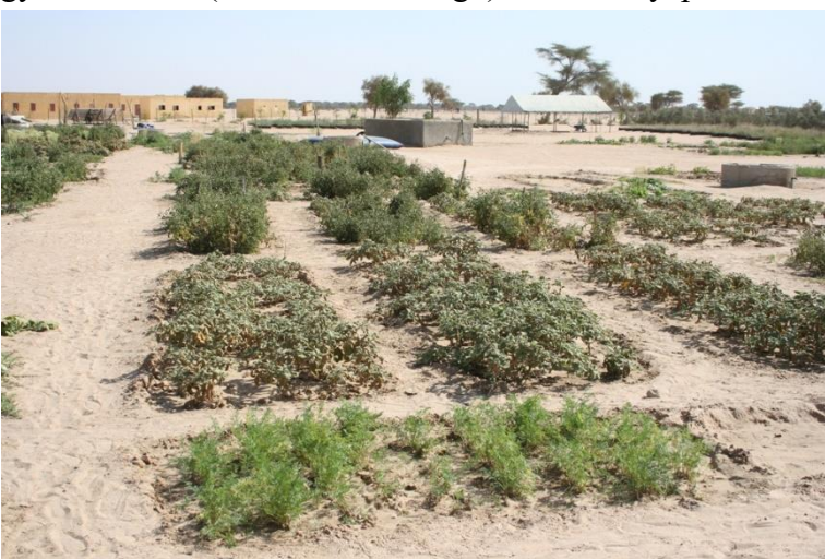
6. kép Naim település mellett is a fő cél a zöldségkertészet meghonosítása, de egy kisebb baromfityénészeti projektet is indítottak

A projekt valójában egyfajta oázisgazdálkodás beindítását célozza, mivel a frissen telepített gyümölcsfák (elsősorban mangó) és datolyapálmák a későbbiekben árnyékadóként is