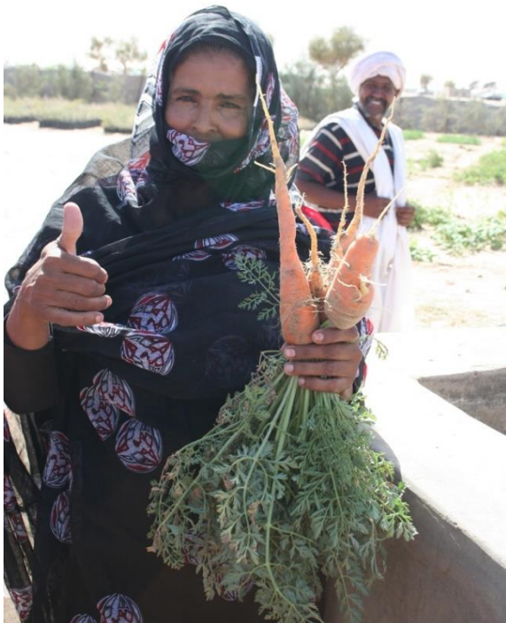
2. kép Az egyik helyi közösség büszke tagja a projekt keretében termelt sárgarépával (Mauritánia)

Az egyes projekteken belül elsősorban a következő tevékenységekben gondolkodnak: