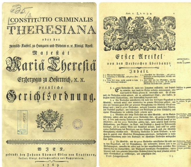
2. kép: Constitutio Criminalis Theresiana címlapja és első oldala

A 18. században Mária Terézia és II. József tett kísérletet egy az osztrák birodalom egésze számára érvényes büntető törvénykönyv elkészítésére. Mária Terézia 1768-ban elkészíttette a Constitutio Criminalis