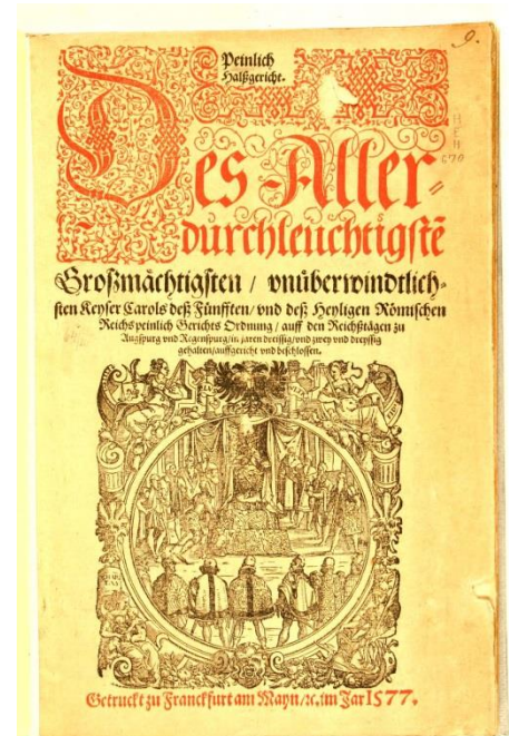
1. kép: Constitutio Criminalis Carolina címlapja