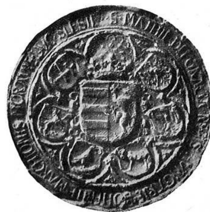
Mátyás király nagypecsége

A király csak a kancellárt nevezte ki, az alkancellárt a jegyzőket, a kancellár jelölte ki a saját familiárisai közül. Ezzel a köztük lévő magánjogi viszony közjogi viszonyra alakult át. Ha a nagykancellár személye változott az egész hivatal kicserélődött, hiszen a nagykancellárral együtt távoztak familiárisai is. Az új pedig hozta a sajátjait ( váltogazdálkodás ). Ebből adódóan ha a kancellár személye változott bizonyos ideig nem működött a hivatal. A problémát Hunyadi Mátyás 1464 -ben hozott dekrétuma oldotta meg. Mátyás egy modern értelemben vett hivatali rendszert próbált felállítani. A hivatalokon belül megszüntette a familiaritási rendszert. Összevonta a nagyobb kancelláriát és a