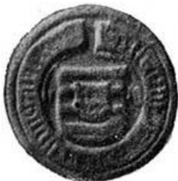
Mátyás király kisebb pecsége

Mátyás szervezte hivatallá a kincstartó köré szerveződött apparátust. Feladata volt az állami pénzügyek intézése, elsősorban az adók és a regálék behajtása. Élén a kincstartó állt.