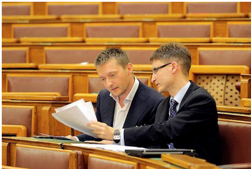
3. kép: Rogán Antal és Cser-Palkovics András 22

Cser-Palkovics András és Rogán Antal egyéni képviselői indítványként 20 előterjesztett törvényjavaslatát 2010. november 2-án szavazták meg, amellyel 2011. január 1-jével életbe lépett a „médiaalkotmány.” 21 Az új jogszabály „egyesítette” a korábbi sajtótörvényt és a médiatörvény értelmező rendelkezéseit a sajtószabadságra vonatkozóan. Az új szabályozás hatálya kiterjed a nyomtatott és az elektronikus sajtóra, illetve az internetes portálokra is; viszont a blogokra végül nem. Fontos eleme, hogy reagált új fogalmi meghatározásokat vezet be, mely követi a technológiai változásokat. A műsorszolgáltató fogalmát, elnevezését a médiaszolgáltató váltja fel; megjelenik a lineáris- és lekérhető médiaszolgáltatás.