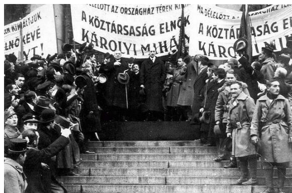
1. Károlyi Mihály köztársasági elnökké választásának ünneplése