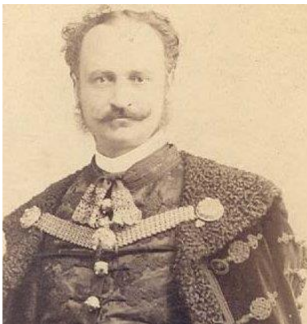
4. br. Wlassics Gyula, a Felsőház első elnöke az újjáalakulását követően