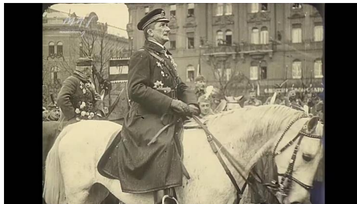
2. Horthy Miklós emblematikus bevonulása Budapestre 1919-ben