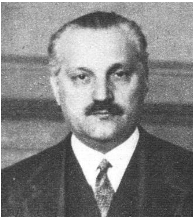
5. Scitovszky Béla belügyminiszter, aki előterjesztette az 1929:XXX. tc. törvényjavaslatát

1929-ben a közigazgatási bizottság első fokú hatáskörét elvonták és az alispánra bízták, a másodfokú hatáskört megszüntették.