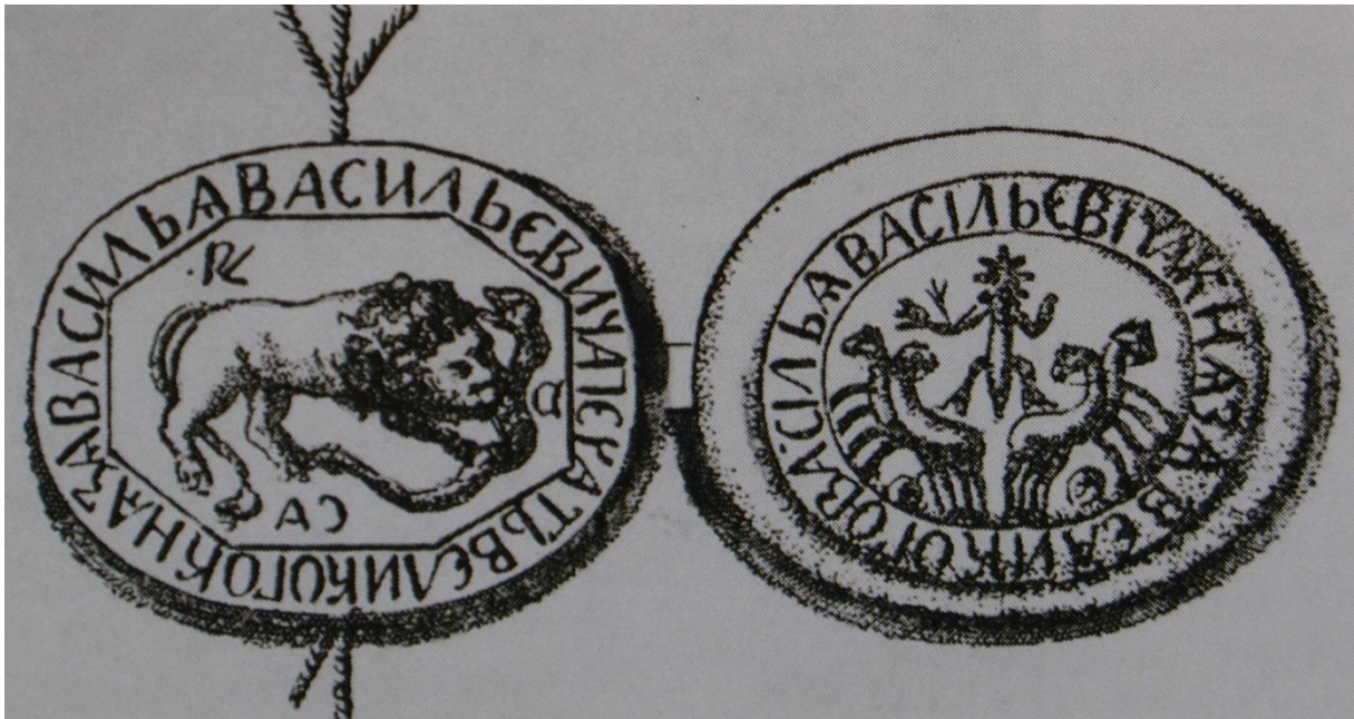
II. (Vak) Vaszilij pecsétje, a végrendeletén (1462)

Vaszilij uralkodásának idejére esett az egyházi önállósodás , a konstantinápolyi patriarchátustól történő függetlenedés egyik fontos eseménye. Az orosz egyház nem fogadta el a Konstantinápoly által kívánatosnak tartott egyházi uniót (az oszmán-török fenyegetés miatt a Bizánci Birodalom a Nyugat segítségében bízott, ezért a nyugati egyházhoz is csatlakozott volna). A ferrarai zsinaton részt vevő és 1441-ben Moszkvába visszatérő Iszidor metropolitát lényegében őrizetben tartották (végül Litvániába szökött). A metropolitai széket végül 1448-ban sikerült újra betölteni, az unióellenes Iona rjazanyi püspök metropolitává választásával. Konstantinápoly török kézre kerülésével az unió kérdése tárgyalanná, de az orosz egyház függetlenedése tartóssá vált ( autokefál egyházzá vált).