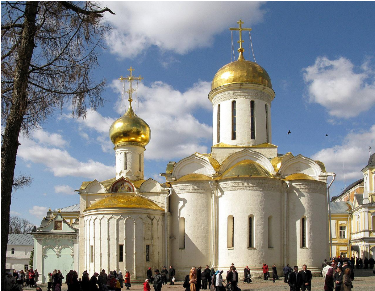
Szentháromság-székesegyház, Szergijev Poszad. A freskóit Danyil Csornij és Andrej Rubljev készítette

A Rusz északi, északkeleti részén a 14-15. században növekedett a megművelt földterület aránya. Ez részben a déli fejedelemségekből elvándorolt lakosságnak is köszönhető, akik a tatár hatalom elől távolabbra költöztek. A földbirtoklás változásával, illetve a birtokok növekedésével a parasztság helyzete is változott. A votcsina és egyházi birtokokon a parasztok két alapvető kategóriája a sztarozsilij („régóta ott lakó”) és a később letelepülők („jövevények” ’szabadok’, ’rjadovicsok’, ’kabalások’, ’Szent György-napkor költözők’). Az újonnan betelepülőket gyakran kedvezményekkel hívták a birtokra. A nagyobb birtokok önálló gazdasági egységet alkottak, számos szakmára szükség volt. Ezeket szolgálók végezték, akinek egy része személyi függőségben lévő holop volt, mások szabad jogállásúak voltak, földdel is rendelkeztek.