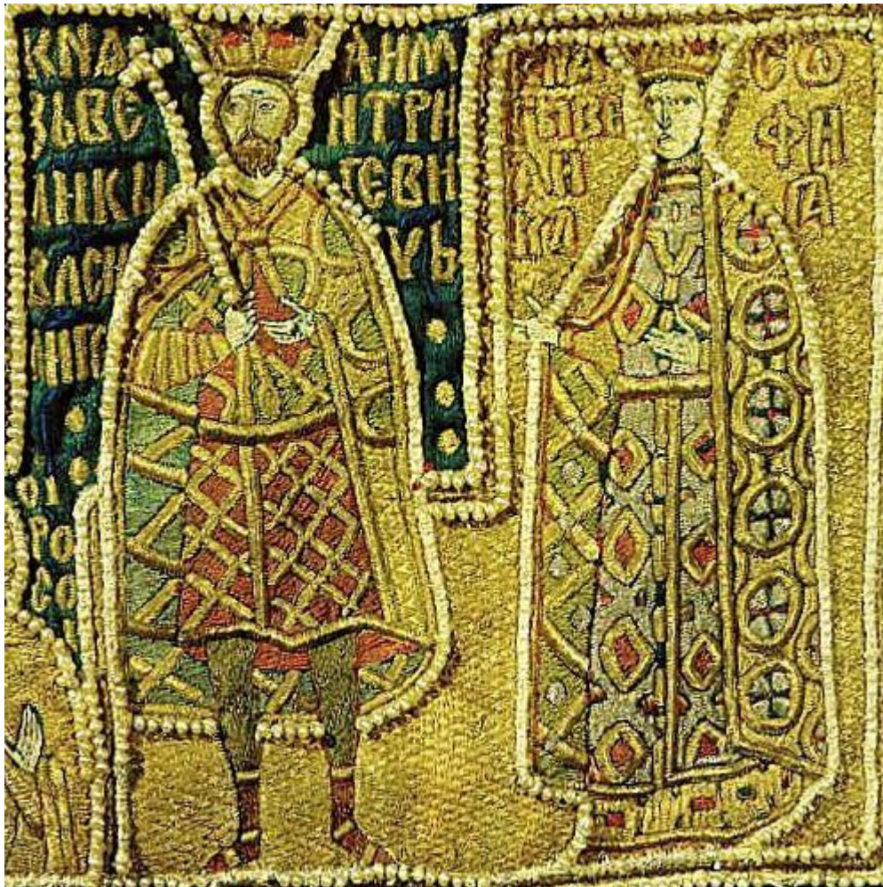
I. Vaszilij és felesége Szofija Vitovtovna portréja Fotyij (Photiosz) moszkvai metropolita díszruháján (szakkosz) (1417 körül) (Wikimedia Commons)

II. Vaszilij (1425-1462) hosszú uralkodása nem volt nyugalmas. Az egyik megoldásra váró feladat a politikai egység megteremtése volt. Ez érintette a trónöröklés kérdését is, mivel a nagyfejedelmek saját elsőszülött fiaikat favorizálták, de az öröklésbe a rokonok is bele akartak szólni. Emiatt körülbelül két és fél évtizedes küzdelem kezdődött, Vaszilij szembekerült nagybátyjával, Jurijjal (megh. 1434) és unokaöccseivel, Vaszilij Koszójjal és Dmitrij Semjakával. A harcokba a tatárok is bekapcsolódtak, gyakran járt tatár sereg a moszkvai földön. Dmitrij Semjaka II. Vaszilijt egy időre börtönbe záratta és megvakíttatta, de Vaszilijnak végül sikerült felülkerekednie (egy másik alkalommal pedig az újonnan megalakult, függetlenedett kazányi tatárok fogságába esett, majd váltságdíj ellenében kiszabadult). 1450 körül azonban Vaszilijnak sikerült a fejedelemség egységét többé-kevésbé helyreállítania. Litvániával 1449-ben szerződést kötött, amelyben megerősítették a békét, és egymás kölcsönös segítségéről is megállapodtak (korábban a litvánok Tvert és Rjazanyt szerződéses kötésével befolyásuk alá vonták, és Novgoroddal is kapcsolatban álltak). II. Vaszilijnak a Tver feletti befolyást sikerült visszaszereznie, az 1456-ban kötött szerződéssel. Ugyanebben az évben Moszkvának Novgoroddal szemben is sikerült keresztülvinnie akaratát. Vaszilij 1462-ben meghalt, a trónt fia, Iván örökölte.