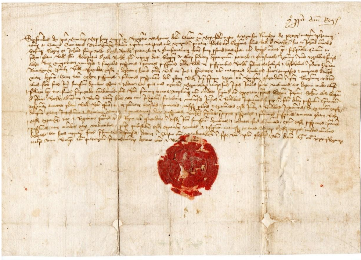
Zsigmond király oklevele (1427)

Az 1526 előtti kancellária intézményes kormányzati szerepe a középkori magyar állam bukásával nemcsak megtört, hanem lényegében meg is szűnt. Helyét alapvetően a magyar uralkodóvá emelt I. (Habsburg) Ferdinánd király korábbi eredetű és idegen történelmi közegben fogant Udvari Kancelláriája ( Hofkanzlei ) foglalta el.