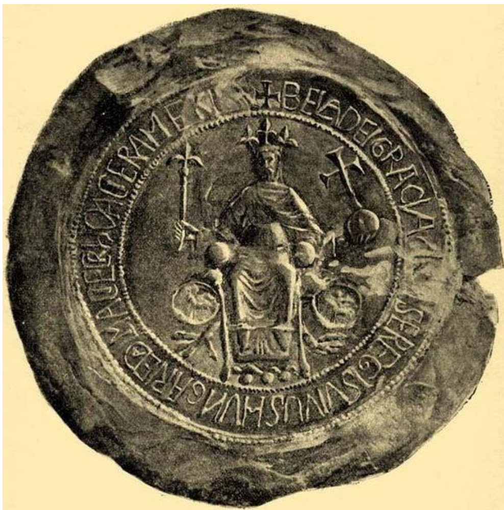
III. Béla király pecsétje

és érsekek – kancellári vagy főkancellári címmel az intézmény élére, de ők szerteágazó egyházkormányzati és szakrális teendőik mellett nem tudták a napi szintű irányító munkát elvégezni a kancelláriában, ezért szerepük inkább eszmei, elvi irányító jellegű. A XIV. század végétől a főkancellár jellemzően az esztergomi érsek volt. A tényleges vezetést azonban a XIII–XIV. század során rendre az alkancellárok látták el, akik jobbára valamelyik királyi alapítású magánegyház, társas káptalan préposti címét viselték (székesfehérvári, budai, pozsonyi, titeli, szebeni prépostságok, stb). A kancellária tényleges irányítása minden esetben fontos bizalmi feladatot jelentett, és az együtt járt a királyi pecsétek felügyeletével és kezelésével. Ennek megfelelően súlya volt annak, hogy az alkancellárok királyi egyházak élén állva töltötték be irányító pozíciójukat. Hosszú ideig az a jellemző alapállapot, hogy képzett egyházi személyzet alkotja a kancelláriát, és vezetőinek egzisztenciája alapvetően viselt egyházi tisztségeik javadalmain nyugodott.