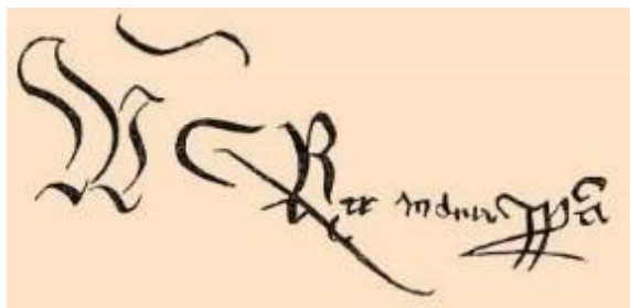
I. Ulászló király aláírása

Az irathitelesítés egyéb lehetőségei között szót érdemel mindenképp az aláírás. Mivel a klasszikus íráshordozókon – papiruszon, hártyán, papíron – szinte megoldhatatlannak tűnt a pecsét lenyomatának tartós fennmaradását eltávolíthatatlanul biztosítani, korán jelentkező igyekezet volt magának az írásnak az alkalmazásával megoldani a hitelesítést. Ez vezetett végeredményben az aláírásnak mint hitelesítő eszköznek a kialakulásához. Sokáig nem vált általánossá, de a középkori pápai, a bizánci és a szicíliai okleveles gyakorlatban előfordulása mégis folyamatosnak és rendszeresnek mondható. Az aláírás Európa nyugati térségében a XIV. század második felétől állandósult, a későbbiekben pedig a pecséttel vetekedő fontosságra tett szert az irathitelesítésben. Magyarországon későn, csak a XV. században jelentkezik alkalmazása. Az első uralkodónk, aki aláírást használt oklevele hitelesítéséhez, I. Jagelló Ulászló király volt az 1440-es évek elején. Esetenként Mátyás király is élt alkalmazásával, de ez azért az ő gyakorlatában is ritkaságszámba ment. Igazi jelentőséget az aláírás csak 1526 után szerzett a magyarországi irathitelesítés gyakorlatában, s fontosságban csak az újkor idején érte be a pecsételést.