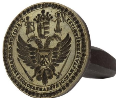
a győri magyar építészcéh pecsétnyomója (1723)

Közép-Európának az első évezred vége körüli időszakra tehető államalakulásait ugyancsak hamar elérte a pecséthasználat átvétele. Magyarországon Szent István idejétől vannak ismereteink pecsétalkalmazásra, amely a kezdeteknél uralkodói pecsét formájában jelentkezett, és ez a jellege a XI. században végig meg is maradt. A korai időszakot e tekintetben nagyrészt német hatások formálták, bár a korai itáliai befolyásnak is némi szerep tulajdonítható, főként a velencei eredetű Orseolo Péter királyságának idején.