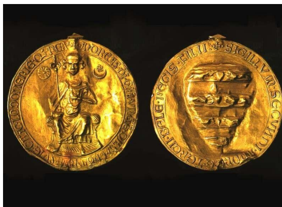
A leghíresebb magyar pecsét: az Aranybulla

Ha a lenyomat értelmű pecsét-fogalom tartalmának tudományos igényű meghatározására törekszünk, azt a következőképpen definiálhatjuk: „kemény nyomóra alkalmazott ábrázolás képlékeny anyagra átvitt lenyomata, amelyet magánszemélyek és testületek megkülönböztető, hiteles jelként használnak.”