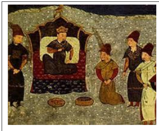
Batu kán (perzsa miniatúra Rasid ad-Dín világtörténetéhez, 14. század (Wikimedia Commons))

A következő években Batu a birodalomban kibontakozó hatalmi vetélkedésben vett részt, és ebben az 1246-ban megválasztott Güjük nagykánal szemben állt, majd Güjük halála után az általa támogatott Möngke lett a nagykán. Batu 1255-ben halt meg. A dzsingiszi parancsot végrehajtotta, ezzel az eurázsiai sztyepp Kínától a Kárpátokig egységesen mongol uralom alá került, a hozzá kapcsolódó erdővidékkel (Szibéria és az európai rész) együtt.