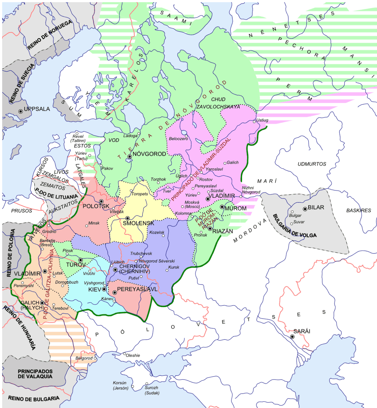
Kelet-Európa a mongol hadjáratok idején (Wikimedia Commons, szerző: Hellerick)

meg a kipszakok területének meghódításával, de ezt Dzsocsi nem érte meg, 1227-ben meghalt. A feladat ettől kezdve Batura hárult ( Batu a fejlécen, Wikimedia Commons ).