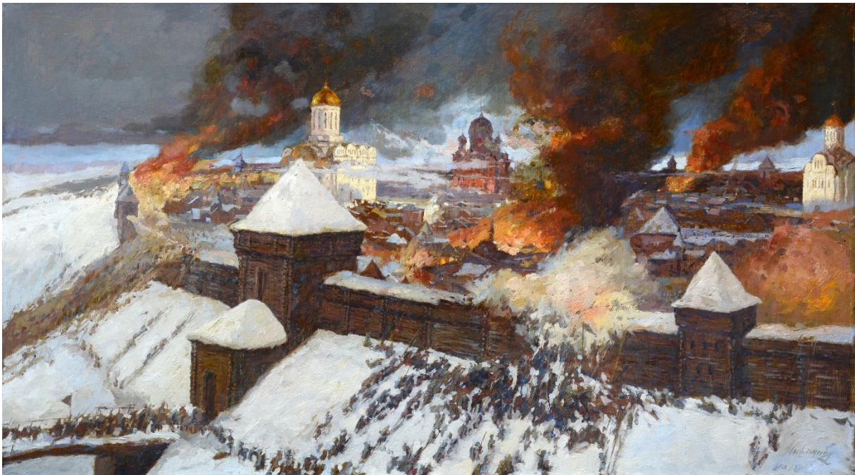
Rjazany ostroma, 1237 december (Andrej Mironov) (Wikimedia Commons)

A következő területsáv a Rusz keleti részét foglalta magába. Ide tartozott a Vlagyimir Szuzdali Fejedelemség és az abból önállósult Rjazanyi Fejedelemség . Az ellenük indított támadás 1237 végén indult meg. Mivel a rjazanyiak elutasították a mongol felszólítást a megadásra és a csatlakozásra, egy mongol sereg vette ostrom alá a fejedelemség központját, Rjazany városát. Rjazany 1237. december 21-én elesett, a mongolok pusztítása itt is hasonló volt, mint amit Biljár átélt.