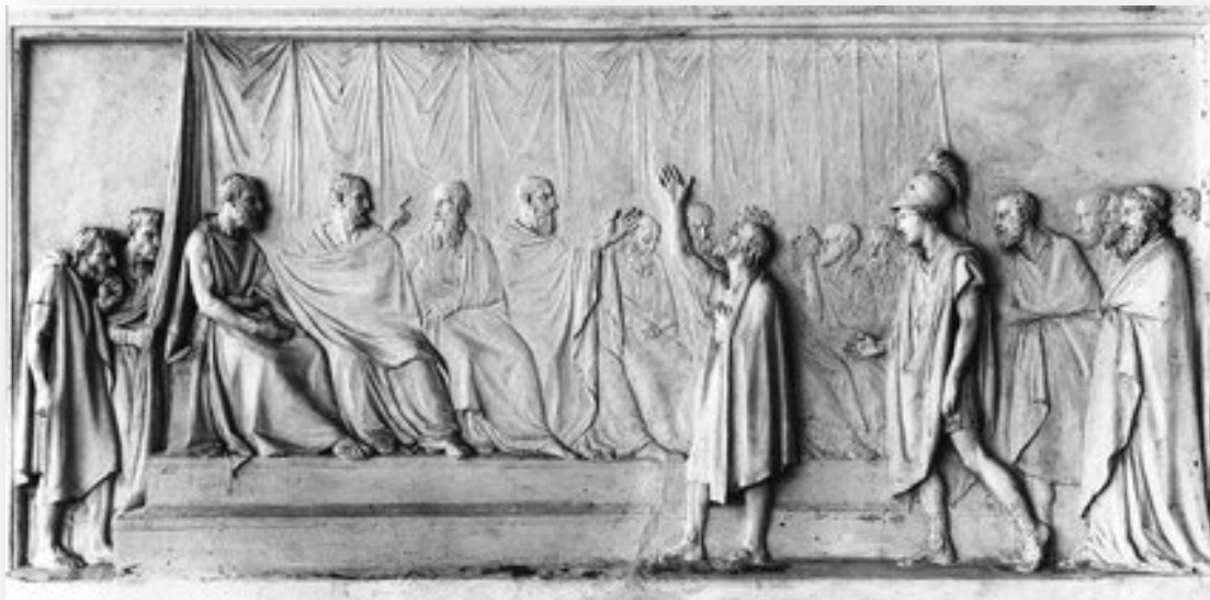
Antonio Canova: Szókratész a bírái előtt (1787/1790)