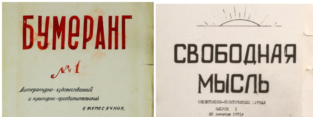
Szovjet szamizdatok: a Bumeráng és a Szvobodnaja Miszl (Szabad Gondolat)

Brezsnyev elődjére hárított minden felelősséget ; és hivatalosan eltörölte a hruscsovi reformokat. A mezőgazdaság talpra állítását célzó reformok és a gazdasági irányítás reformtervei lényegében mégis elődje elképzeléseit tükrözték. A valódi gazdasági reform papíron maradt , mert ideológiai okokból nem tűrték meg az önálló kezdeményezéseket; mégis kialakult egy (fekete) második gazdaság.