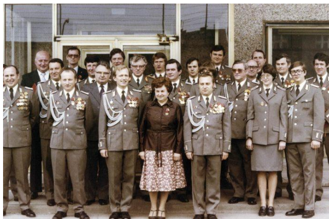
A Stasi jelképe és egyenruhás tagjai

A másik előfeltételt a szovjet büntetőjogi elvek átvétele jelentette. Ennek során új büntető törvénykönyveket dolgoztak ki, szigorú szabályokkal védve a párt uralmát, az új társadalmi rendszert, a tervgazdálkodást, a „szocialista” tulajdont. A munkához való jog munkakötelezettséget is jelentett, tehát büntették a munkakerülőket, sőt azokat is, akik engedély nélkül hagyták ott munkahelyüket („ önkéntes kilépés ”). A legfontosabb azonban a Visinszkij-elv alkalmazása volt. Az 1930-as évek szovjet főügyésze, Andrej Visinszkij ugyan könyvében tagadta, hogy a szovjet jog erre épülne, gyakorlatilag azonban ez valósult meg. Ezen elv kimondja, hogy a bűnösség igazolásához elég a beismerő vallomás ; nem a bűnösséget, hanem az ártatlanságot kell bizonyítani. Ez azt is jelentette, hogy eltörölték az ártatlanság vélelmét: