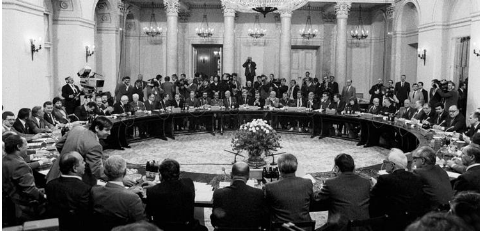
A lengyel kerekasztal-tárgyalás 1989-ben

tudta felszámolni az ellenállást, legfeljebb a föld alá kényszeríteni. 1989 elején a hadiállapotot bevezető Wojciech Jaruzelski tábornok kénytelen volt beleegyezni, hogy a kerekasztal tárgyalás induljon el a Szolidaritással. Ennek eredménye a többpártrendszer engedélyezése, a szenátus visszaállítása, és egy „félszabad” választás megtartása volt júniusban. Az alsóház (szejm) képviselői helyeinek csak 35%-áért folyhatott a küzdelem, a szenátusban viszont valamennyi mandátumért. A Szolidaritás elsöprő győzelmet aratott, három hónapos huzavona után végül nagykoalíciós kormány alakult nem kommunista miniszterelnökkel, Tadeusz Mazowiecki vel az élén. Jaruzelski köztársasági elnök lett, de a LEMP 1990-es kettészakadása után távoznia kellett és Lech Wałęsa lett az új államfő.