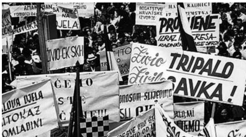
Tüntetés a horvát tavasz idején

A jugoszláv modell gazdasági téren kifejezetten reformer volt. Vegyes tulajdoni rendszert vezettek be. Az állami tulajdont „társadalmasították” (elvileg a munkástanácsok irányították), de emellett a magánszektornak is teret adtak. A szabad vállalkozás és a haszonelv elfogadása mellett volt állami ellenőrzés. A mezőgazdaságban 1950-ben ideiglenesen, majd 1953-ban teljesen lemondtak a kollektivizálásról és 10 hektáros magánbirtokokból álló rendszer alakult ki. A Nyugattal kiépített gazdasági kapcsolatok mellett nem meglepő, hogy nem csak szabad volt a Nyugatra utazás. 1965–66-tól túl hirtelen vezettek be piaci reformokat, ami eladósodást és munkanélküliséget is okozott. Ugyanakkor lehetséges volt a külföldi munkavállalást, főleg az NSZK-ban dolgozott sok jugoszláv vendégmunkás. Ezzel csökkent a hazai munkanélküliség és jelentős keményvaluta-bevételhez jutott az ország. Teljesen sikertelen volt ugyanakkor az országon belüli régiók fejlettsége közötti eltérés csökkentése. A legfejlettebb Szlovénia és az elmaradott Koszovó egy főre jutó nemzeti jövedelmének különbsége 1955–88 között 4×-ról 9×-re nőtt. A szlovén és a horvát területek helyi vezetői gyakran panaszkodtak is amiatt, hogy jövedelmeiket elvonják, és minden eredmény nélkül az elmaradott területeket próbálják felzárkóztatni abból.