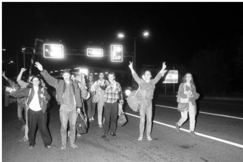
Megnyílik a magyar határ a keletnémet menekültek előtt

Az események 1989-ben felgyorsultak. A lengyel változások indukálták a magyar eseményeket, az pedig további dominóhatást váltott ki. Ami a lengyeleknek tíz évbe tellett, Magyarországon tíz hónap, az NDK-ban tíz hét, Csehszlovákiában tíz nap, Romániában pedig tíz perc alatt végbement. Ezen időtartamokat persze jelképesnek kell tekinteni, de jól mutatják be az események felgyorsulását, ami korábban elképzelhetetlen változásokat hozott magával. Így lett 1989 a csodák éve (annus mirabilis).