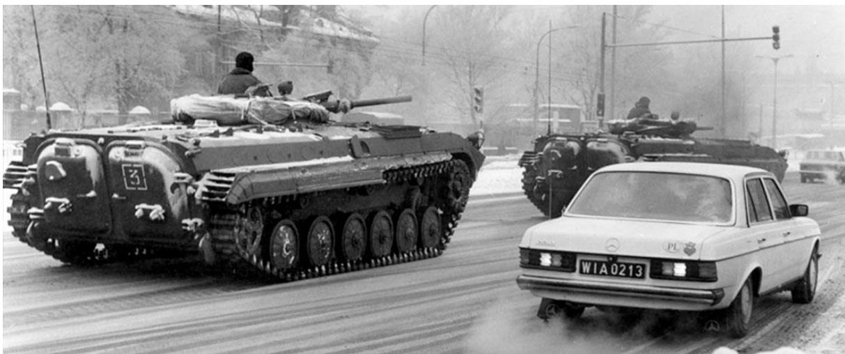
Hadiállapot Lengyelországban, 1981 decembere

Giereket közben leváltották. Egy rövid ideig regnáló vezető után 1981 -ben Wojciech Jaruzelski tábornok került a LEMP élére. Ő volt a párt hatodik vezetője 1945 óta; ilyen sok vezetőváltás egyetlen szocialista országban sem történt (ráadásul Gomulka két alkalommal is volt a párt vezetője). A tábornok titokban előkészített akció révén 1981 decemberében hadiállapotot vezetett be . Az ellenzéki vezetőket letartóztatták, lapjaikat betiltották. Kijárási tilalmat vezettek be, az utcákon tankok csikorogtak, az üzemeket is katonák biztosították. A Szolidaritás illegális ba szorult, de nem szűnt meg. 1983 -ban feloldották a hadiállapotot, s Jaruzelski óvatos piaci reformokkal kísérletezett , de ezek 1985–86 -ra kifulladtak. A rendszer nem tudott úrrá lenni a gazdasági nehézségeken, éveken át jegyrendszer volt érvényben. A föld alatti Lengyelországban milliók vettek részt , s hatalmas tömegek indultak külföldre, hogy a „ KGST-piacokon ” próbáljanak kisvállalkozóként megélhetést találni.