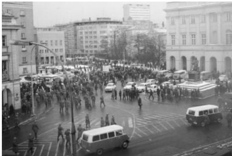
1968 márciusa Varsóban: rendőri támadás a tüntetők ellen

1968-ban egyetemisták tüntettek a diktatúra ellen, amit a belügyi erők többször is szétverték, ezeket tartóztattak le. A pártvezetés az egész értelmiség ellen támadást indított, amibe erős antiszemita hangok keveredtek. A mozgalmat sikerült elfojtani. Gomulka a prágai tavasz elleni beavatkozás egyik lehangosabb követelője is volt.