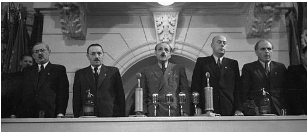
A Lengyel Egyesült Munkáspárt alakuló ülésének elnöksége, 1948

A szovjetizálás ütemének felgyorsítása a Kommunista és Munkáspártok Tájékoztató Irodája (Kominform) alapító ülésének 1947 őszi döntésére következett be. Itt hangzott el a két tábor szembeállító szovjet Zsdanov-doktrína és célul tűzték ki a szociáldemokrata pártok likvidálását is. Erre Németország keleti felében már sor került 1946 tavaszán, a többi országban viszont 1948 folyamán meg végbe a munkáspártok „egyesülése” (valójában az SZDP-k beolvasztása). Az egyesülési folyamatot több szociáldemokrata ellenezte, őket kizárták és sok esetben perbe fogták és elítélték (esetleg emigrációba menekültek). Ugyanez történt korábban a polgári pártokat képviselő politikusokkal is.