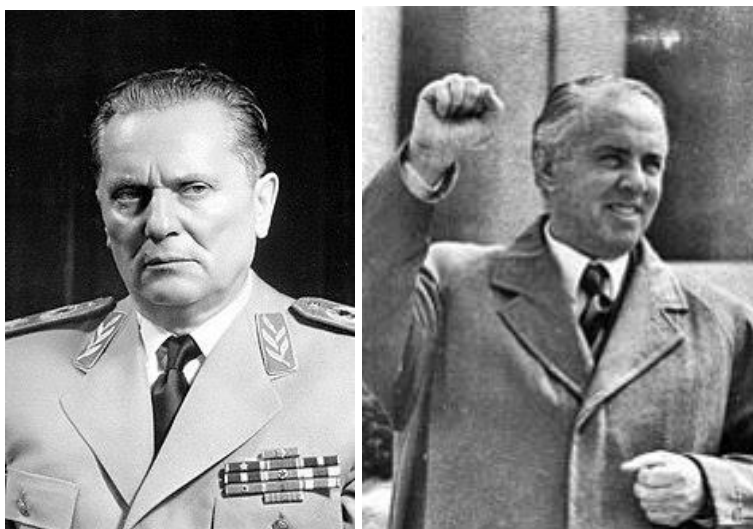
Josip Broz Tito és Enver Hodzsa

1980-ban meghalt Tito. Ezután évente új személy áll a párt élén és a köztársasági elnöki poszton is, rotációs rendszerben mindig más tagállamból. A gazdasági válság mellett az évtized fő sajátossága a koszovói feszültség éleződése volt. Az albán (és muzulmán) népesség-robbanás felerősítette az előző időszak horvát törekvései miatt már eleve kialakult szerb nemzeti aggodalmakat. Nagyszerb törekvések jöttek létre. A szerbeknek csak 60%-a élt Szerbiában, ottani arányuk csökkent is; céljuk az volt, hogy minden szerb Szerbiában éljen, emellett az ország szerb vezetésű recentralizálását is követelték. Különösen zavarta őket az, hogy Szerbia volt az egyetlen tagállam, amelyben autonóm területek (a Vajdaság és Koszovó) is voltak.