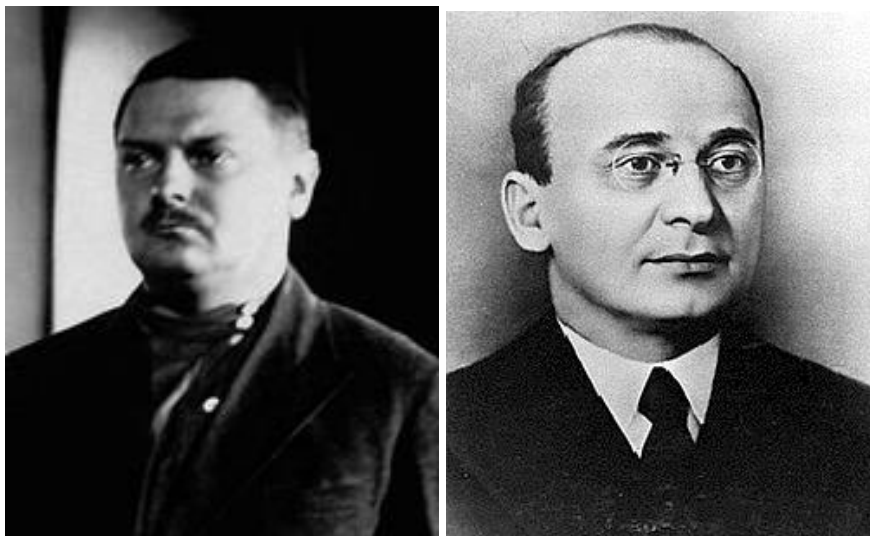
Andrej Zsdanov és Lavrentyij Berija

1946-ban a szovjet állam szervezete átalakult. Az addigi népbiztonságokat minisztériumokká szervezték át, így a belügyi tárca NKVD-ből MVD lett, az állambiztonsági pedig NKGB-ből MGB-vé változott. Szintén átnevezték a Vörös Hadsereget, melynek neve ezután egyszerűen Szovjet Hadsereg volt. Jelentősen nőtt a párt tagsága, de csökkent köztük a munkások aránya. A párt neve 1952-ig Össz-szövetségi Kommunista (bolsevik) Párt volt, csak az ekkor megtartott XIX. kongresszus nevezte át a Szovjetunió Kommunista Pártjává (SZKP). A párt legfőbb szerve, a Politikai Bizottság ekkor Elnökség néven alakult újjá. Még Sztálin életében utódlási harcok kezdődtek el. 1948-ban bekövetkezett haláláig Andrej Zsdanov számított Sztálin legesélyesebb utódának. Egy rivális klikk élén Georgij Malenkov és Lavrentyij Berija állt, ám Zsdanov halála után később Sztálin új favoritja Nyikita Hruscsov lett.