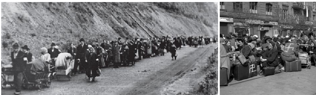
A németek kitelepítése Csehszlovákiából

Csehszlovákia és Németország szovjet megszállási zónája között eleinte jelentős különbség volt. Előbbi győztes országnak számított, ahová még a szovjetbarát háború előtti köztársasági elnök, Edvard Beneš is visszatérhetett posztjára. A Vörös Hadsereget ki is vonták az ország területéről és fennállt az az illúzió, hogy az ország demokratikus berendezkedésű marad, igaz, kommunistákkal a kormányában (ami Nyugaton is előfordult). Prága úgy vélte, politikájával hidat képezhet a Nyugat és Kelet között . Ezzel szemben Németország vesztes volt, állami szuverenitását elvesztette, önálló politikája megszűnt, keleti részén hatalmas szovjet hadsereg állomásozott. A Szovjet Katonai Adminisztráció minden tekintetben irányította a területet ( nácitlanítás , gazdasági kizsákmányolás, pártok engedélyezése stb.). Formálisan a négy megszállási zónában ugyanazon pártok jöttek létre (kommunista, szociáldemokrata, kereszténydemokrata, liberális), de a keleti zónában már az 1946-os tartományi választások sem voltak szabadok (Berlin kivételével). Ezt a két munkáspárt 1946 áprilisi egyesülése után létrejött Német Szocialista Egységpárt nyerte meg.