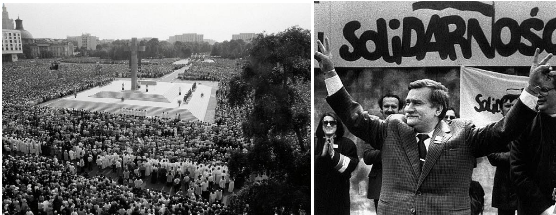
Tömegek II. János Pál lengyelországi látogatásán – Lech Wałęsa és a Szolidaritás

Edward Gierek pontosan egy évtizedet (1970–80) töltött a LEMP és az ország élén. Korábbi helyi párttitkársága idején a „jó gazda” hírében állt, ekkor azonban az egész ország gazdasági és politikai rendbetétele várt rá. Az ország gyors népességnövekedése állandó munkahelyteremtést követelt meg, ami továbbra is extenzív fejlődésre ösztönzött. Gierek terve az volt, hogy ha jobb fizetést adnak a munkásoknak , akkor hajlandók lesznek jobban teljesíteni és így intenzív fejlődés is végbemehet. Ennek érdekében jelentős hiteleket vett fel az ország, ám ez az életszínvonal-politika nagyon kockázatos volt. Kiderült, hogy a munkások a jobb fizetések ellenére sem növelték a termelékenységet. A kibontakozó olajválság (1973) tovább rontotta a feltételeket, az ország adósságcsapdába esett . Amint megszorításokra került sor (1976-ban), azonnal újabb tiltakozó akciók, tüntetések bontakoztak ki. Ezeket ismét erőszakkal (bár kevésbé brutálissal) fojtották el. Egyre erősebb ellenzéki tiltakozásokra került sor, megalakult a Munkásvédelmi Bizottság nevű ellenzéki szervezet , amely „ második nyilvánosságot ” tudott kialakítani szamizdat -kiadványai révén. A hívő katolikus lengyelek számára nagy erőt adott a lengyel pápa : többszáz év után először 1978 -ban nem olasz bíborost választottak meg katolikus egyházfővé II. János Pál néven. (A nyolcvanas években többször is ellátogatott Rómából szülőhazájába.)