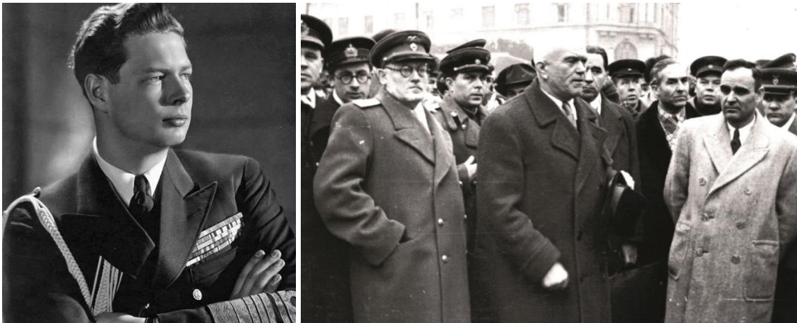
Mihály román király – a szovjet Andrej Visinszkij (balra) „kinevezi” Petru Groza (középen) kormányát, 1945-ben. Jobbról Gheorghe Gheorghiu-Dej, az RKP vezetője

A két ország viszonylag sokáig királyság maradt, így fordult elő az a világpolitikai paradoxon, hogy egy kommunista országban még mindig király volt az államfő. A román király, Mihály hajtotta végre talán a világ egyetlen királyi sztrájkját is, amikor nem volt hajlandó aláírni a baloldali kormány törvényeit. E koalíciót Mihály eleve csak szovjet nyomás (Erdélylyel való zsarolás) következtében nevezte ki.