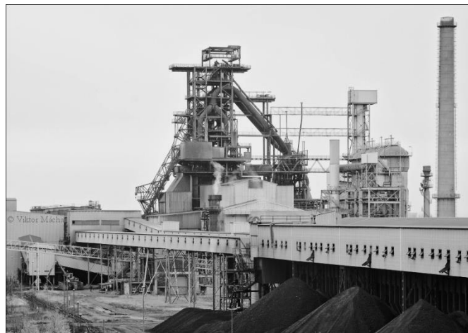
Vaskohó az NDK-ban

A Sztálin-korszak fő sajátossága Kelet-Közép-Európában a homogenizálódásra való törekvés . Bár Albánia és Csehország fejlettsége között óriási különbségek voltak, ebben a korszakban igyekeztek őket teljesen hasonló államokká alakítani (a többiekkel együtt). A nemzeti hagyományokat, eltérő sajátosságokat nem vették figyelembe. Az összes országnak a szocialista építés szovjet tapasztalatait kellett követnie , az ettől való legkisebb eltérést is ideológiai elhajlásnak bélyegezték és büntették. E tekintetben csak az NDK volt kivétel : mivel Sztálin 1952-ig fenntartotta a reményt a két német állam egyesítésére, ezért addig nem indult el a sem kollektivizálás, sem a nehézipar fejlesztése, az alkotmány pedig még a vállalkozás szabadságát és a sztrájkjogot is tartalmazta. Emiatt az NDK-t a népi demokráciáknál is „kevésbé fejlettnek” tekintették ekkor.