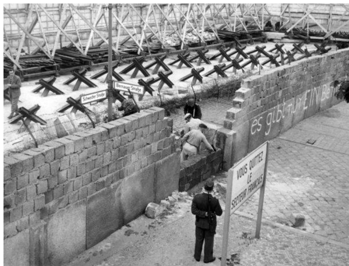
Épül a berlini fal

1953-ban Sztálin után pár nappal meghalt Gottwald is. A CSKP élére első titkárként Antonín Novotný került. Az új vezetés egy valutareformmal szinte lenullázta a lakosság anyagi megtakarításait, ami ellen több városban, köztük Plzeňben zavargások törtek ki. Ezt követően a CSKP kifejezetten figyelt az életszínvonal növelésére, s a hasonló válságokat sikerült is ezután elkerülnie. Bő két héttel Plzeň után az NDK több száz városában is munkásfelkelések törtek ki, amit szovjet tankok vertek le. Szovjet javaslatra mindkét ország kísérletezett egy új szakasz bevezetésével a gazdasági és politikai életben. Az NSZEP vezetője, Walter Ulbricht ingadozó pozícióját a párt élén paradox módon épp a felkelés (leverése) erősítette meg.