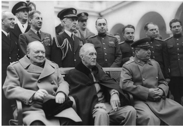
Churchill, Roosevelt és Sztálin a jaltai konferencián, 1945

1945 tavaszára Kelet-Közép-Európa túlnyomó része a Vörös Hadsereg fennhatósága alá került. Egyedül Jugoszlávia és Albánia területét szabadították fel a német és olasz megszállás alól a helyi partizánerek (Josip Broz Tito jugoszláv kommunista vezetésével). A történetírásban vita van arról, hogy Sztálin eleve szovjetizálni akarta-e térséget, vagy csak a hidegháború kényszere okozta ezt később. A jelek inkább az előbbire utalnak, bár eleinte a szovjetek egyes országokban átmenetileg elfogadtak egy látszat-demokratikus berendezkedést.