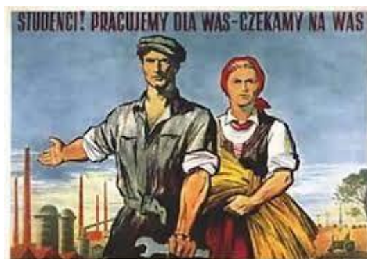
Tipikus „szocreál” plakát Lengyelországból

Jelentős mértékű volt a gazdaság mellett a társadalom átalakítása is. Folytatódott az elitcsere. A régi vezető rétegek „deklasszálódtak”, elvesztették osztály-jellegüket. Vagyonukat elkozták, kitelepítették őket házaikból, sokakat elítéltek, mások emigráltak (amíg erre még volt lehetőség). Helyettük a megkezdődött egy munkás–paraszt származású új elit és új értelmiség kinevelése (gyakran „gyorstalpaló” képzéseken, vagy egyenesen oktatás nélkül). A régi elitbe tartozókat viszont az oktatásban is hátrányosan különböztették meg. A tömegoktatásban viszont voltak eredmények: a Balkánon is megszűnt az írástudatlanság. A kommunista országok talán egyetlen valódi sikerét ezen a téren érték el. Voltak pozitív eredmények a kultúra területén is, bár itt ellentmondásosabb a kép. A „magaskultúra” fogyasztása terén jelentős előrelépés volt, a könyvtárba, színházba járok száma soha nem volt olyan magas, mint az ötvenes és hatvanas években. A művészeti irányzatok közül azonban csak a „szocialista realizmus” kapott támogatást, minden más (nyugati, burzsoá, „dekadens”) stílust lényegében betiltottak, még a 20. század előttiakat is korlátozták. Végül pedig teljes kudarcba fulladt a „szocialista embertípus” kinevelése, ami pedig a kommunizmus megteremtésének is feltétele lett volna.