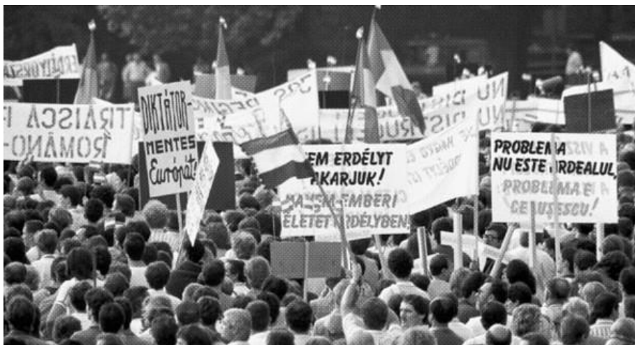
Tüntetés Budapesten a román falurombolási program ellen, 1988

A hetvenes évek elején Románia mérsékelte a szovjetellenességét , illetve felhagyott a blokk közös intézményei reformjának akadályozásával. A nemzeti irány ettől kezdve inkább belpolitikai, nacionalista irányba fordult . E tendencia Bulgáriára is jellemző volt, mindkét országban a gazdasági nehézségek leplezését, a figyelemelterelést is szolgálta. A román diktatúra szigora egyre fokozódott. Ideológiai okokból vissza akarták fizetni a nyugati hitelek is, amit túlmunka, a fogyasztás drasztikus visszafogásával, részben pedig a zsidó és a német kisebbség keményvalutáért való kiárúsításával ( emigrálásukért Izrael és az NSZK fizetett ) oldottak meg. De sokat lehetett hallani a „szocialista román nemzet” kiformálódásáról, a románok ősiségéről és felsőbbrendűségéről.