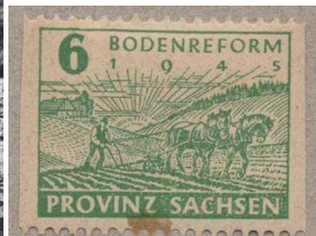
Propagandafotó és bélyeg: földosztás Kelet-Németországban, 1945

Szintén közös vonás volt a gazdaság átalakítása. Földreform mindenhol lezajlott, bár jelentősége ott volt nagyobb, ahol nagybirtokrendszer állt fenn korábban (lengyel, magyar, német). Ezúttal is jellemző volt a kisebbségek diszkriminálása, de a föld elkobzása a katolikus egyházat is jelentősen sújtotta. Mindenütt erősödött az állami beavatkozás, erre az újjáépítés miatt szükség is volt. A legsúlyosabb károk lengyel és jugoszláv területen voltak. Az ENSZ-től érkezett ugyan némi segítség, viszont szovjet nyomásra ezen államok elutasították a Marshall-segély igénybevételét. Így kézi erővel, lelkesedéssel kellett újjáépíteni ezen országokat. Többnyire már 1945-ben megindultak az államosítások is. Először a német tulajdont sajátították ki, majd több lépcsőben a nemzeti tőkét is. Ez utóbbit legkésőbb, 1948–50 között Románia és Bulgária tette meg. Legkésőbb 1947-ben azonban minden országban elkezdődött a tervgazdálkodás is. Az első tervek Jugoszlávia kivételével 2-3 éves újjáépítést írtak elő, míg Titoék már ekkor szovjet típusú, iparosító jellegű ötéves tervet fogadtak el.