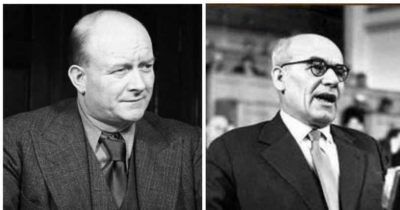
Stanisław Mikołajczyk és Władysław Gomułka

A Lengyel Munkáspárt élén Władysław Gomułka állt. Vele szemben a polgári oldal fő ereje a Lengyel Néppárt volt Stanisław Mikołajczyk vezetésével. Küzdelmük egyenlőtlen felek harca volt, az LMP durván meghamisította a népszavazási és választási eredményeket 1946 és 1947 során. Mikołajczyk emigrált. A szovjet típusú kommunizmust ugyanakkor Gomułka sem tartotta járható útnak. Még az után is kitartott a szocializmus felé vezető lengyel út programja mellett, hogy Jugoszláviát a saját útja miatt kiátkozták a táborból. A „titoista” Gomułkát leváltották a párt éléről (1948), utóda az addigi „pártonkívüli” köztársasági elnök, Bolesław Bierut lett. Itt sem jött létre egypártrendszer, s az ország a történelmi címerét is megtartotta. A szocialistákkal „egyesült” párt neve Lengyel Egyesült Munkáspárt (LEMP) lett.