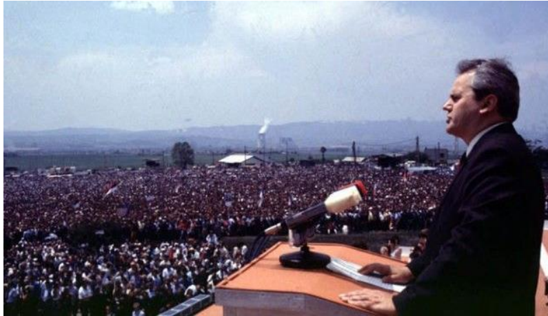
Slobodan Milošević szerb pártvezető 1989-es koszovói beszéde

Eddig megszűnt létezni a Szovjetunió is. Már 1988-tól itt is felszínre törtek nemzetiségi–nacionalista mozgalmak (főleg a Baltikum, Kaukázus, Moldova területén). A Molotov–Ribbentrop paktum 50. évfordulóján kétmillió tüntetés volt a Baltikumban. Gorbacsov elítélte a szeparatizmust, időnként fenyegetőzött, sőt volt példa erőszakra is. 1990-ben a három balti állam és Moldova függetlenségi nyilatkozatot tett. Eközben a Szovjetunió belüli Oroszország elnökévé demokratikus választással Borisz Jecsin került. 1991 késő nyarán ő gátolta meg a KGB-sek Gorbacsov-ellenes puccskísérletét Moszkvában. Ezután Ukrajna és Belarusz is függetlenségi nyilatkozatot adott ki, a balti államokat pedig nemzetközileg elismerték. 1991 decemberében a három szláv tagállam vezetője megegyezett a Szovjetunió felszámolásáról. Létrejött a Független Államok Közössége (12 tagállam). Gorbacsov lemondott megszűnt országa elnöki posztjáról Sok millió orosz rekedt Oroszország határain kívül („orosz Trianon”). Békés módon sikerült kettéválnia Csehszlovákiának. Három év alatt nyilvánvaló lett, hogy a csehek és szlovákok útjai is elváltnak. 1993 legelején két új állam jött létre.