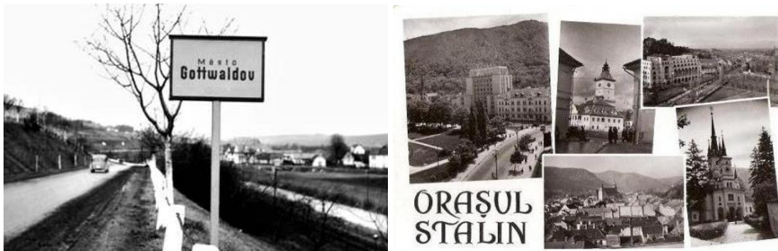
Gottwaldváros (ma Zlín, Csehország) és Sztálinváros (ma Brassó, Románia)

Részlet Gerő Ernő beszédéből Rákosi Máttyás magyar pártfőtitkár 60. születésnapján, 1952. március Tiszteljük, becsüljük, szeretjük Rákosi elvtársat, mert egész népünk jól ismeri azokat a hatalmas eredményeket, amelyeket pártunk, munkásosztályunk, országunk az ő bölcs vezetésével ért el. Tiszteljük, becsüljük, szeretjük Rákosi elvtársat, mert ő Lenin és Sztálin legjobb magyar tanítványa, és mert senki nem tett országunkban annyit, mint ő azért, hogy a magyar munkásosztály, a magyar nép Lenin-Sztálin útját kövesse, hogy megvalósuljon és elmélyüljön népünk barátsága a nagy Szovjetunió népeivel! Tiszteljük, becsüljük, szeretjük Rákosi elvtársat, mert minden becsületes magyar, hazánk minden igazi fia érzi, tudja: Rákosi és a párt – egy! Rákosi és a magyar munkásosztály – egy! Rákosi és a magyar nép – egy!