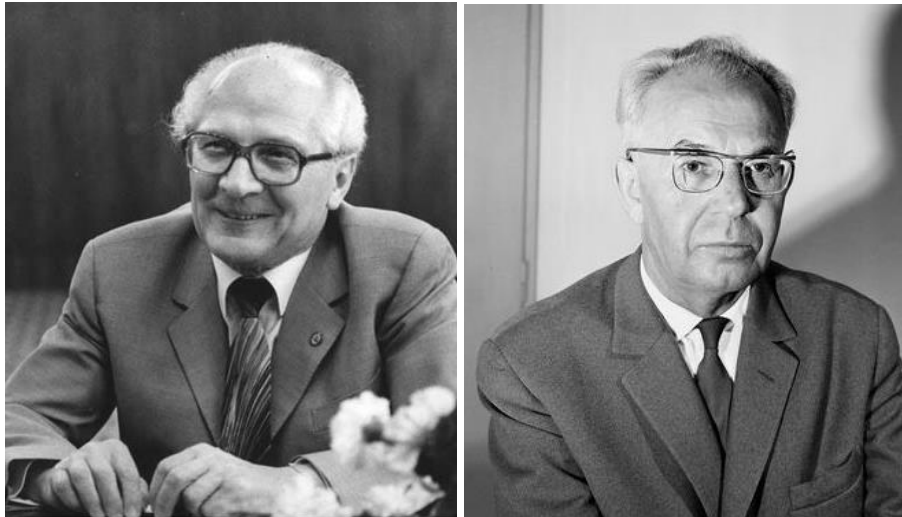
Erich Honecker keletnémet és Gustav Husák csehszlovák vezető

valóságát is. Gazdasági reformjai sem nyerték el az NSZEP vezetőinek támogatását. Utóda Erich Honecker lett, akinek célja a szocialista osztálytársadalom aktív felépítése volt. A szociálpolitikai juttatások mellett növelte a „népi tulajdont” (a magán és ipari szövetkezeti szektor államosítása révén, 1972-ben) és kialakította az NDK saját „nemzeti” identitását. 1974-ben az alkotmány is deklarálta az új „szocialista nemzet” létrejöttét (vagyis az egységes német nemzet megszűnését).