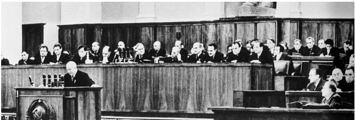
Hruscsov beszédet mond az SZKP XX. kongresszusán

1953 őszén hivatalosan első titkárrá választották Hruscsovot. Eleinte komoly hatalmi harcok zajlottak a „reformerek” és a „keményvonalasok” között. Hol az egyik, hol a másik tábor volt erősebb, a párt vezetője pedig próbált egyensúlyozni közöttük. Emiatt szélsőséges bakugrások zajlottak le a szovjet politikai irányvonalban: desztálinizálás és resztálinizálás, a világpolitikában pedig az enyhülés és a feszültség állandó váltakozása következett (ezt nevezték Hruscsov „kótyagos” politikájának).