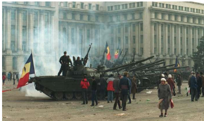
A román forradalom. Bukarest, 1989

A Balkánon a rendszerváltások némileg másképp alakultak. A csodák éve ugyan ide is begyűrűzött, de itt sokkal inkább csak hatalomváltásra került sor. Bulgáriában ez nyíltan zajlott: Zsivkov novemberben megbukott, a reformkommunisták vették át a hatalmat és 1990-ben a közben szocialistává átnevezett utódpárt a többpárti választáson is győzni tudott az ellenzéki Demokratikus Erők Szövetsége felett.