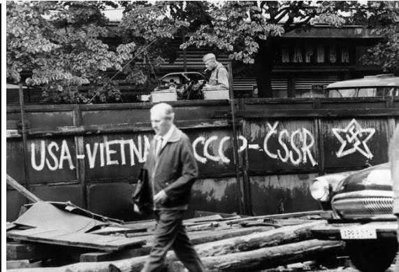
A megszállás ellen tiltakozó röplapok és falfirkák. Csehszlovákia, 1968

Az NDK-ra és Csehszlovákiára is jellemző volt, hogy a keményvonalas rendszerért a jó életszínvonal lal kárpótolták a társadalmat. Eltűrték a polgárok kettős magatartását (az otthoni és hivatalos viselkedés teljesen eltérő volt), ami miatt passzivitás, apátia, cinizmus alakult ki . A viszonylag bőséges ellátást komoly szociálpolitikai vállalások egészítették ki (családtámogatás, lakásépítés stb.) Emellett viszont mind a Stasi , mind a csehszlovák StB (állambiztonság) igen aktív maradt az egyházak, ill. ellenzéki csoportok megfigyelése terén. A keletnémet evangélikus működése mégis szabadabbá vált, s 1977-től egyre aktívabbá vált a csehszlovák emberi jogi ellenzéki mozgalom ( Charta '77 , Václav Havel ).