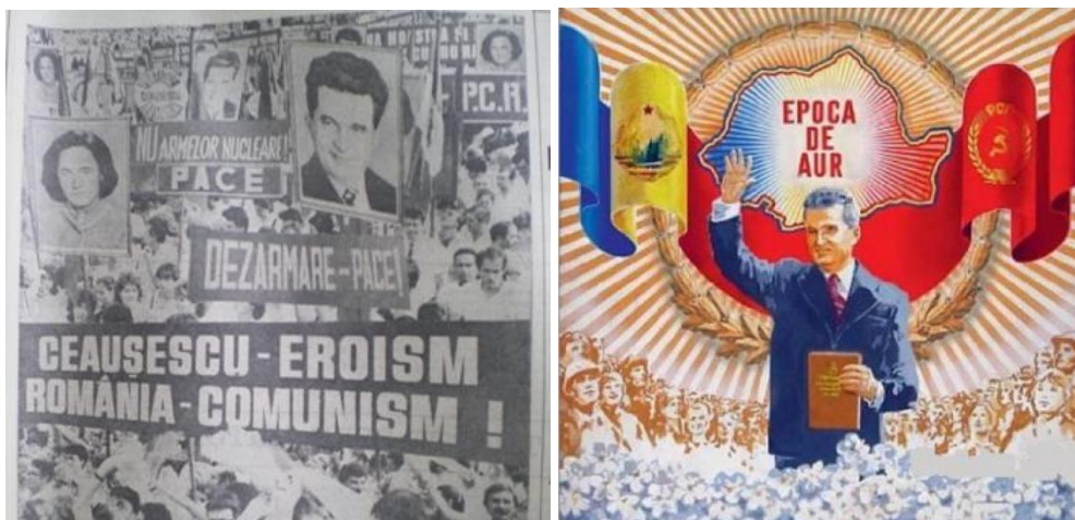
Vezérkultusz Romániában: Ceaușescu – hősiesség. A másik plakáton az „aranykor”

Ezzel szemben Bulgária politikai alapelve a Moszkvához való igazodás volt, talán az egész blokkon belül a legerősebb szovjet kontroll alatt állt. Az ország nyíltan segítette a KGB külföldi akcióit, akár a terrorizmusig elmenve. Még a szovjet–kínai szakítás előtt , az ötvenes évek végén Szófia is kísérletezett kínai minta másolásával (a kínai „ nagy ugrás ” átvételével). Az 1960-as években komoly reformtervek voltak Bulgáriában is, de egy 1965-ös puccskísérelt, illetve az 1968-as prágai események hatására végleg szakítottak vele.