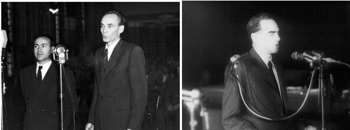
Rajk és Slánský a bíróság előtt

A kommunista rendszerek tömegterrort valósítottak meg. A régi elitsoportok tagjai mellett az egyszerű munkások és parasztok – elvileg a társadalom vezető rétegei – ellen is tömegesen léptek fel. Mondvacsinált vádakkal internálták, vagy bíróság elé állították őket. A leg-hírhedtebb eljárások azonban a párt vezetőségén belüli „önfelszámoló perek” voltak. Ezek kapcsán kell tárgyalni a konceptiós per fogalmát. Ezek lényege az volt, hogy egy előre megírt forgatókönyv, tehát (pre)konceptió alapján indították el őket. Nem valódi bűnököt akartak megtorolni, hanem egy politikai célt kívántak velük elérni (tehát nem az igazság feltárása volt a szándékuk). A vádak többnyire (de nem mindig!) koholtak, alaptalanok voltak. Brutális szadizmussal és lelki kényszerrel is alkalmazva törték meg a vádlottak ellenállását. Ha ez sikerült, a következő, ironikusan „szanatóriumnak” nevezett szakaszban a vádlottak „külsőalakját” próbálták helyrehozni: megszűnt a verés, hogy sérüléseik begyógyuljanak, némileg javult az ellátásuk. Erre persze csak akkor került sor, ha a per nyilvánosan zajlott (ezek voltak a kirakatperek ). Ilyenkor a vádlottak, az ügyvédek, ügyészek, sőt a bíró is előre betanulta szövegét, a per inkább színházi (tragi)komédia volt. Zárt tárgyalás esetén persze erre nem volt szükség . A legtöbb országban a tapasztalt szovjet „szakemberek”, Berija és munkatársai dolgozták ki és felügyelték a koncepciót és annak végrehajtását.