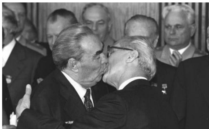
A „baráti csók”: Brezsnyev és az NDK vezetője, Honecker üdvözli egymást

Hruscsov 1959-ben Eisenhower meghívására az Egyesült Államokban járt. Az amerikai kukorica-termelés lenyűgözte őt, s lelkesen látott hozzá a kukorica- és az arra alapozódó hústermelési program végrehajtásához. Nem tántorította el az sem, hogy korábbi mezőgazdasági programja, a szűzföldek feltörése sem járt sikerrel (a szél elhordta a termőtalajt). Az életszínvonal emelésének ígérete ismét kudarcot vallott. A kótyagos, kapkodó reformok és a decentralizálási tervek a pártapparátus ellenállását is kiváltották. 1964-ben a párt belső reformjával elégedetlen káderek megbuktatták Hruscsovot . Utódává Leonyid Brezsnyev et választották. Ismét átmenetileg kollektív vezetés jött létre. Brezsnyev (elődjéhez hasonlóan) szétválasztotta az első titkári és a kormányfői posztot, amit Hruscsov 1958-tól újra egy kézbe vont össze. Vele szemben Brezsnyev 1977-től az államfői posztot vette át . 1966-tól ugyanő főtitkárként állt a párt élén és visszaállította a Politikai Bizottság elnevezést is.