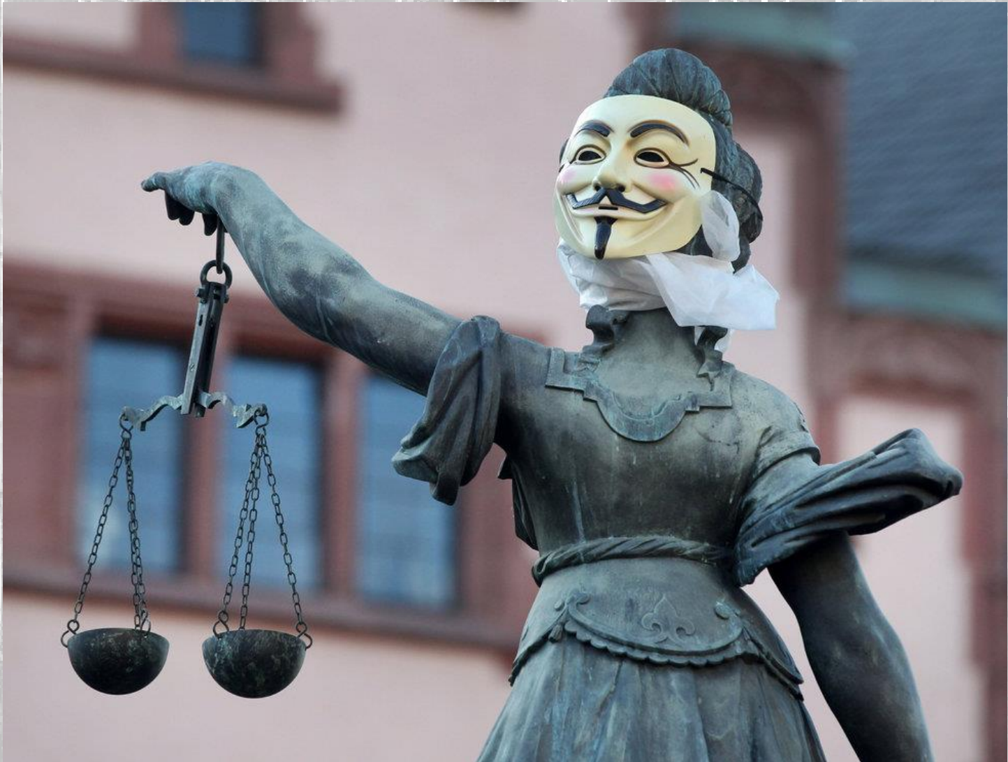
Fountain of Justitia, Frankfurt/M.