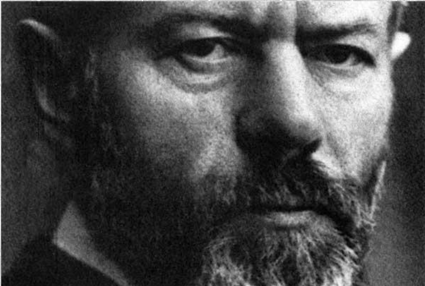
Max Weber (1864-1920)