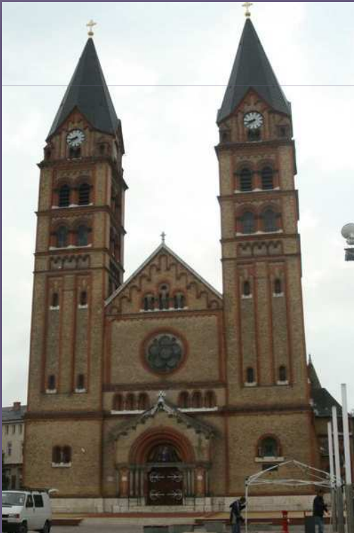
Római Katolikus templom – Nyíregyháza