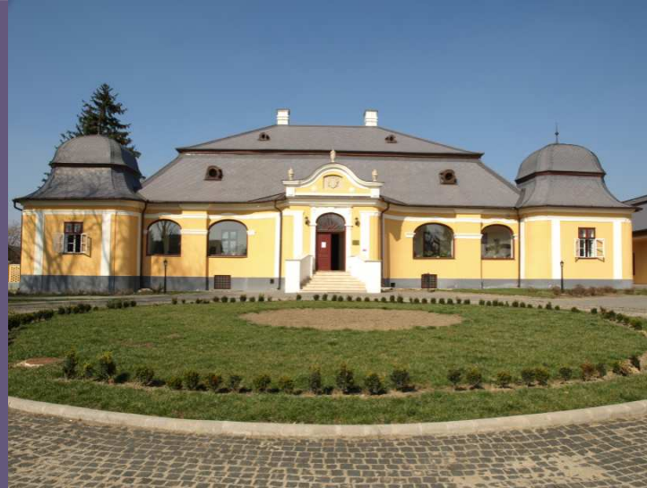
Tomcsányi-kastély – Vásárosnamény