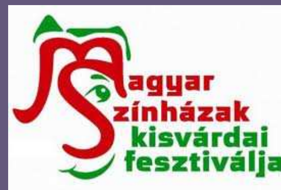
SZÍNHÁZ FESZTIVÁL - Kisvárdai