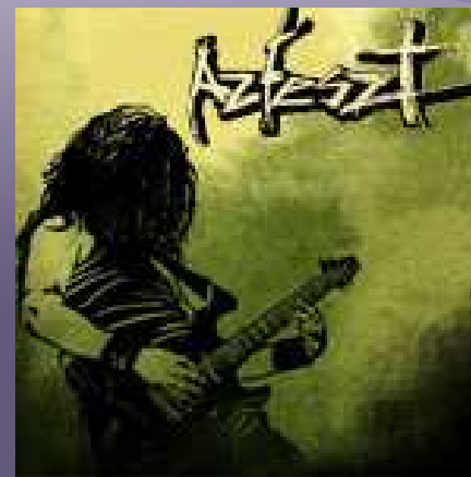
AZFESZT - Nyírbátor