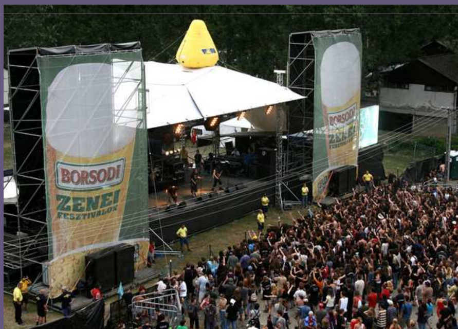
HEGYALJA FESZTIVÁL - Rakamaz