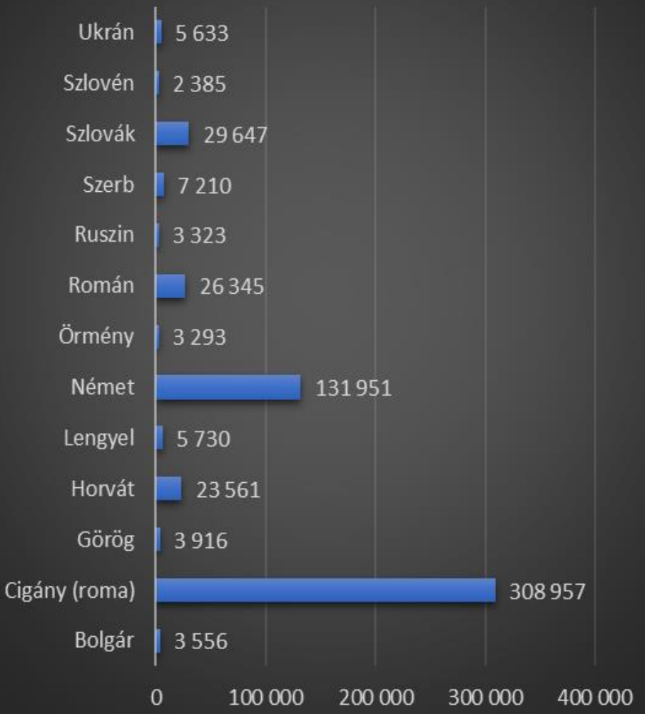
Hazai, nem magyar nemzetiségűek száma (2011)