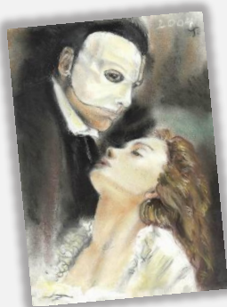
@ Fantom, ez a titokzatos lény

Az ismeretlen székhelyű cég megszüntetésére irányuló eljárás alanya a székhelyén, telephelyén fióktelepen és a képviseletre jogosult révén elérhetetlen cég . Tekintettel arra, hogy különleges törvényességi felügyeleti eljárásról van szó, a megszüntetési eljárás a cégtörvény hatálya alá tartozó, a cégjegyzékbe bejegyezhető cégformák esetében indítható meg . Nincs lehetőség tehát ismeretlen székhelyű cég megszüntetésére irányuló eljárás lefolytatására cégnek nem minősülő más vállalkozási formában működő jogalanyok vagy jogalanyiség nélküli szervezetek, illetve a cégjegyzékbe még be nem jegyzett vagy már törölt gazdasági társaságok esetében.