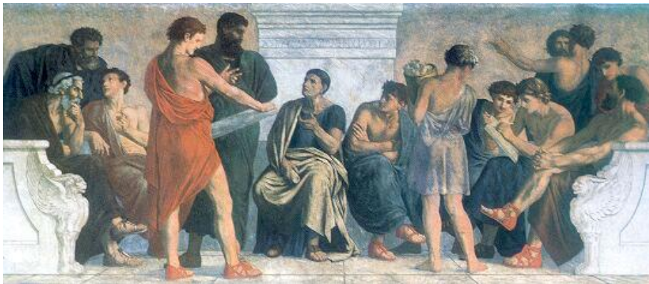
Arisztotelész iskolája a Lykeion egy XIX. századi festményen

Arisztotelész gyakorlatias gondolkodását bizonyítja, hogy a hagyomány szerint összeállított egy 158 alkotmányból álló gyűjteményt, amely a görög polisok államformáit tartalmazta (ez azóta elveszett). Az alkotmány görögül politeia. Azt az alaptörvényt jelenti, amely meghatározza az állam formáját, berendezkedését, az államszerveződés fő céljait, a politikai intézményrendszer működését. Azért alaptörvény, mert a mindennapi élethez szükséges törvényeket is ehhez kell igazítani, azaz semelyik törvény sem mondhat ellent az alkotmánynak.