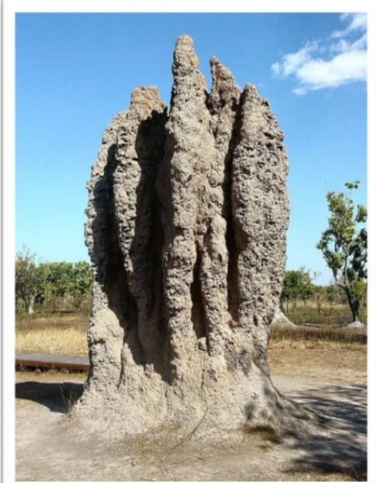
Termeszék által létrehozott hatalmas építmény (termeszvár)

Az emberi cselekvésekben megkülönböztethetünk egoista és altruista cselekvéseket. Az egoista cselekvéseket az önérdék, az altruista cselekvéseket a másik ember érdeke motiválja. Az altruizmust a segítőkészség, az önfeláldozás, a másik gondozása, a vele való törődés fogalmai fedik le. A jó ebben az esetben morális jó , mivel a magatartás és a cselekvés arra irányul, hogy a másik embernek jó legyen. Azaz úgy cselekszem, hogy a másik ember életben maradásra irányuló törekvését segítsem.