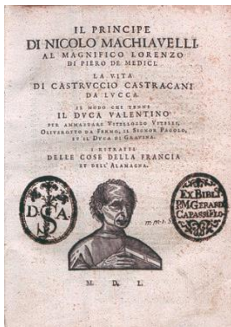
A fejedelem 1550-es kiadásának címlapja

A politikafilozófiák egyik alapvető vonása, hogy nagy figyelmet fordítanak az emberi természet kérdésére. Ennek az az oka, hogy az emberi közösségek természetének vizsgálata feltételezi a közösségeket alkotó individuumok természetének megértését. Mint korábban láttuk, Platón és Arisztotelész is az emberi természetből indul ki, és mindkettőjük számára fontos volt az ember boldogságra törekvése, mint az emberi természet meghatározó vonása. Ebből vezették le a politika általános célját. Majd a modern politikafilozófiákban is látni fogjuk (Hobbes, Locke, Rousseau gondolkodásában), hogy milyen nagy figyelmet fordítanak arra, mi jellemzi az emberi viselkedést minden társadalmi meghatározottság nélkül (a természeti állapotban), és ebből kiindulva fogják meghatározni a politikai szerveződés fő céljait.