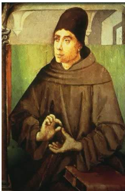
Johannes Duns Scotus (1261-1308) Justus van Gent 15. századi festménye