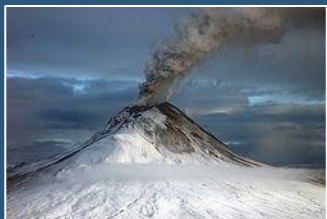
Augustine alaszkaí aktív vulkán

heti. A cégbíróság eljárási cselekményeit tekintve az eljárás során felhívja a hitelezőket, az egyéb érdekelteket, a tagokat és a vezető tisztségviselőket a cég vagyonával kapcsolatos adatok közlésére, valamint dönt a cég megszüntetéséről vagy felszámolási eljárás kezdeményezéséről . A döntési jogosítványok azonban korlátozottak abban az aspektusban, hogy a cégbíróság nem csupán a kényszertörlési eljárás megindítására, hanem annak lefolytatására is köteles, így nem határozhat az eljárás megszüntetéséről.