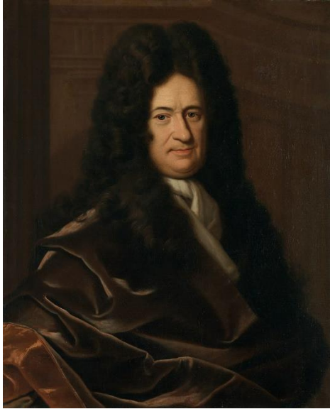
Gottfried Wilhelm Leibniz (1646-1716)

Leibniz német gondolkodó, az egyik legösszetettebb racionalista metafizikai rendszer megalkotója. Gondolkodásnak korai szakaszában arisztotelészi hatások érték, minek következtében sokkal kevésbé volt kritikus és ellenséges az arisztotelészi metafizikával, mint kortársai. Descartes műveivel csak később ismerkedett meg. A nagy karteziánus gondolkodókhoz képest, mint Malebranche, Spinoza, Arnauld. Fénelon fenntartásokkal kezelte a descartes-i szubsztancia-elméletet. Elvetette a szubsztancia-dualizmust és bizonyos értelemben rehabilitálta a szubsztanciális formák tanát . Metafizikai rendszerét monadológiának nevezte, amelyben teljesen új szubsztancia-fogalmat vezetett be.