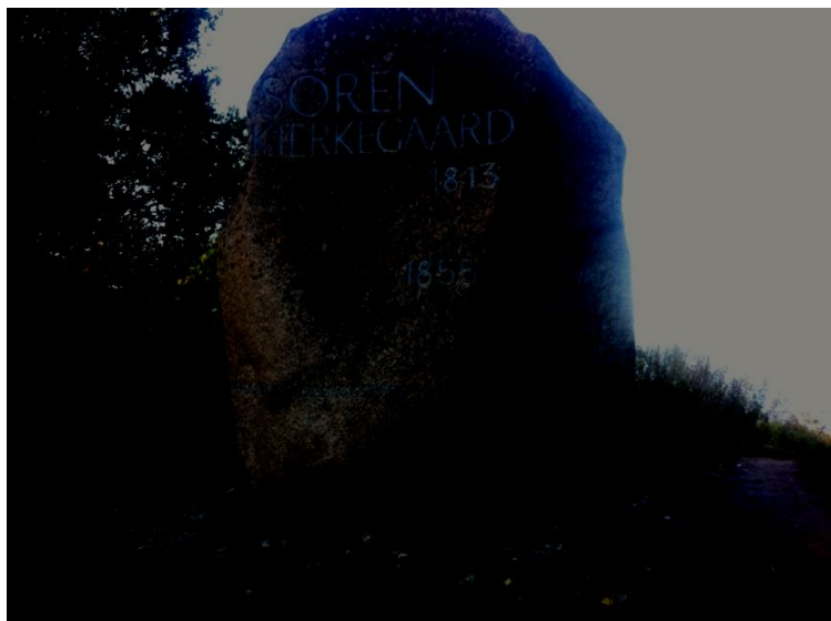
Søren Aabye Kierkegaard emlékoszlopa Gilleleje-ban