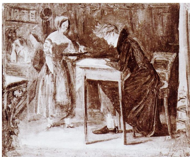
Christian Olavius Zeuthen: Søren Kierkegaard in the coffee-house. 1843

Kierkegaard tevékenységét két részre szokás osztani, amelyet a Lezáró tudománytalan utóirat határol. Ugyanakkor műveit aszerint is osztályozni lehet, hogy vannak a pszeudonim (álneves), és a saját név alatt megjelent művek. Filozófiai műveit általában álnéven írta. Az álnév nem az elrejtőzést, hanem inkább a poliszemitást szolgálta. Rövid alkotói pályája (1841-1855) ellenére hatalmas terjedelmű életművet alkotott.