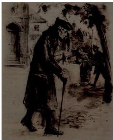
G. Wolf: Kant sétája, Königsberg Múzeum

Életét, amely külső történésekben nem volt eseménydús, számos anekdota övezte, amely természetes kapcsolatban állt a maga választotta életvitellel. A magiszteri vizsga után a königsbergi egyetemen magáncocensként tanított, azaz abból élt, amit óráiért a tanítványok fizettek. Ennek megfelelően egy roppant szigorú életrendet alakít ki, amelyet rigorózan követ élete végéig. Soha nem nősült meg, kisebb utazásoktól eltekintve városát sem hagyta el. Ebből az életvitelből származik a mondás: a königsbergiek Kant sétáihoz igazították az órájukat.