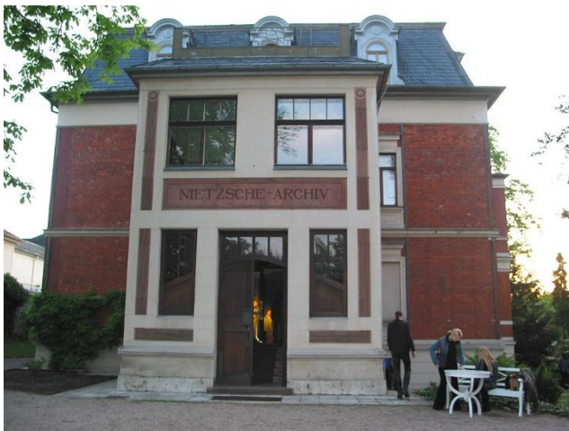
A Nietzsche Archivum

A legkülönbözőbb irányokból : a fasizmusok és második vh. civilizációs katasztrófája nem csupán az ortodox államszoc. számára diszkreditálta az életművet. Lukács Gy. (legalábbis marxista korszakában) és B. Russell kevés dologban értettek volna egyet, abban viszont feltétlenül, hogy Nietzsche prefasiszta, protonáci, irracionalista, antihumanista gondolkodó.