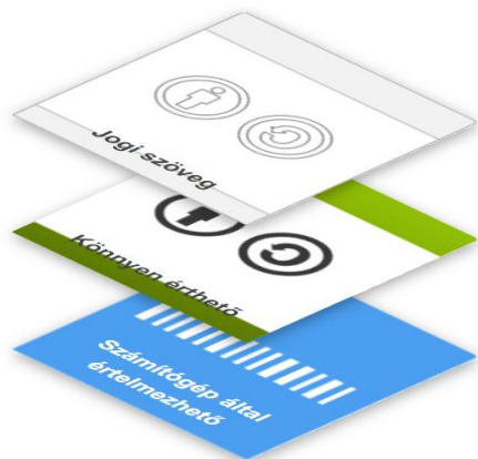
1. ábra. A CC licenszek 3 rétege