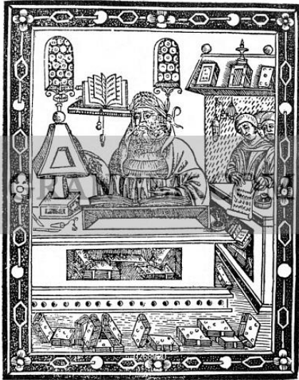
Peckham portréja Perspectiva communis című műve 1504-es kiadásában.

John Peckham (ca. 1230-1292), Canterbury érsekének indirekt bizonyítása (a jelölések feloldása a lenti ábrán!)