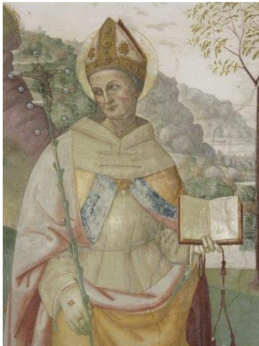
Szent Bonaventúra, Tiberio d'Assisi festménye, 1509 Stroncone

Bonaventura (1221-1274) indirekt bizonyítása: