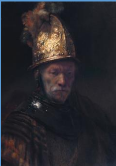
Az aranysisakos férfi

Alapvetően elmondható, hogy a társadalom azokat az embereket értékeli, tekinti sikeresnek, akik mögött komoly teljesítmény áll, nagyon ritka, és múlandó azoknak a sikere, akiknél ez teljesítmény nélkül következik be.