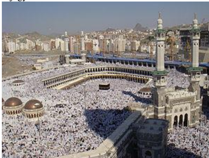
7. ábra: Zarándoklat Mekkában

Minden hívőnek törekednie kell arra, hogy egy életben legalább egyszer, ha arra mód és lehetőség nyílik, eljusson Mekkába, ugyanis a hagyomány szerint Mekka az a hely, ahol minden próféták ősatyja, Ábrahám próféta fiával, Iszmáellel a világon elsőként az egy isten tiszteletére szentélyt építettek. E szentély sarokköve Kába köve, melyet Allah zárókönek adott le a rá való emlékezés jegyében.