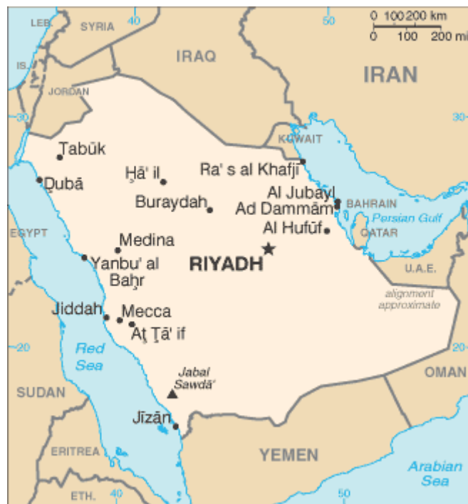
1. ábra: Mekka

Vallásos élettel leginkább a letelepedett, városlakók körében lehetett találkozni. A városokban voltak az arab istenségek központi szentélyei, ezekhez a nagy országos vásárok és búcsúk alkalmával a legtávolabb vidékről érkeztek emberek. A legfontosabb szentély hírében állott a Mekka városában mai napig is tisztelet tárgyát tevő Kába, az arab pogányság legfontosabb központja.