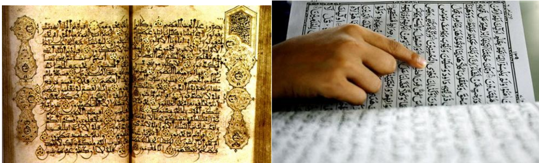
4. ábra: Korán

Az iszlám alapvető és elsődleges forrása a Korán . A Korán az iszlám szent könyve, tanításainak és törvényeinek legfőbb forrása, melyet a muszlimok Isten végső kinyilatkoztatott szavának tekintenek, tehát isteni kinyilatkoztatás, benne minden szó Istentől származik. A Korán a hit alapjaival, az erkölccsel, az emberiség történetével, az imádsággal, a bölcsességgel az Isten és ember kapcsolatával, továbbá az emberi viszonyok különböző formáinak megnyilvánulásaival is foglalkozik. A Korán és az iszlám összes többi forrása is arab nyelven íródott. Az arabok rendkívül tisztelik és ragaszkodnak nyelvükhöz, az imákat is kizárólag arab nyelven végezhetik.