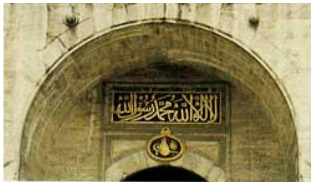
5. ábra: Topkapi szeráj, Sahada felirat

Minden muszlim felesküszik és esküjében kitart abban, hogy nincs más Isten, mint Allah és Mohamed az ő prófétája. Ez az eskü az egyistenhitre és az egy istent hirdető prófétákra, akik sorát Mohamed zárta.