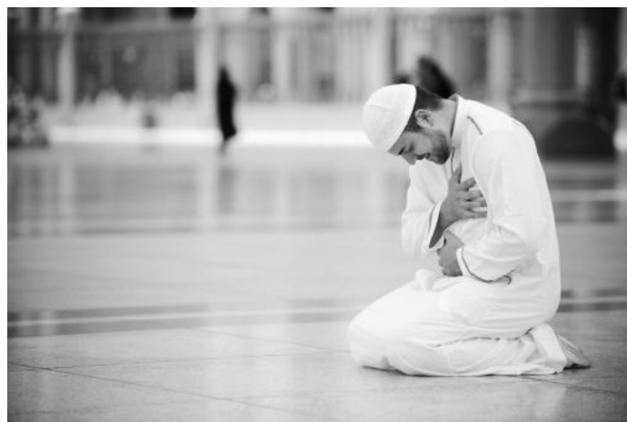
6. ábra: muzulmán ima

A hívők kötelessége a napi öt ima, mellyel állandó kapcsolat teremődik köztük és Isten között, valamint erősödik az egymás közötti kötelék térbeli eltolódástól függetlenül. A napi öt imaalkalom: hajnali, déli, délutáni, naplementi és esti ima, mely elvégezhető egyénileg vagy csoportosan, azonban a pénteki kongregáció imája a mecsetekben mindig csoportos.