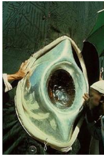
2. ábra: A Kába kő

A mekkai Kába kő azonban kiemelt tiszteletnek örvendett már ebben az időszakban is, és tulajdonképpen ez az egyetlen tárgyi maradvány az iszlám előtti világból, amely az iszlám vallásban is helyet kapott.