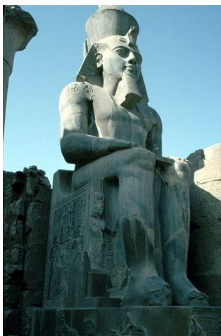
6. ábra: II. Ramszesz

Az egyiptomi fogság története a késő bronzkorba esett (1550-1200); s az egyiptomi birodalom, amelyet a 18. dinasztia fáraói alapítottak, kétségkívül a világ uralkodó nemzete volt. A birodalom talán legismertebb uralkodója II. Ramszesz volt, akinek uralkodása alatt tört ki a háború a hittitákkal, amely aztán évekig elhúzódott.