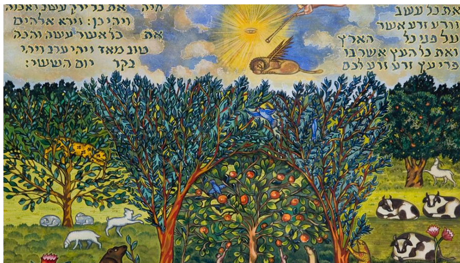
2. ábra: Adam és Éva az Éden kertjében (Ori Sherman/Magnes Collection of Jewish Art and Life)