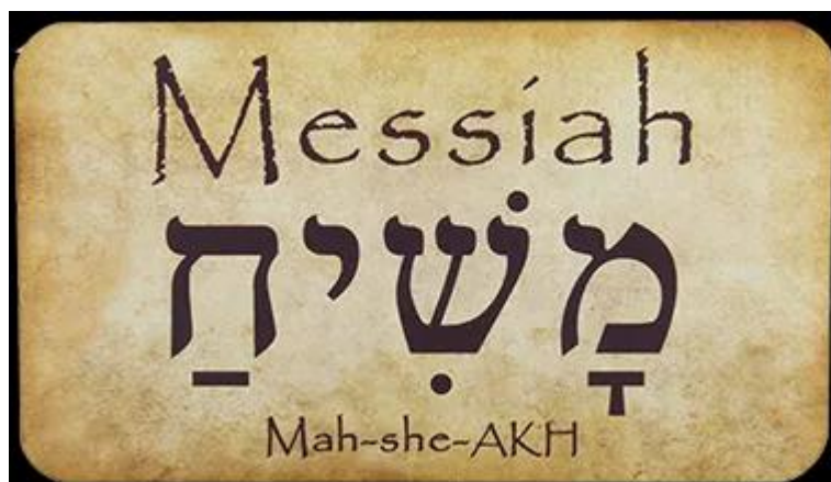
3. ábra: A Messiás szó héberül

A kereszténységben Krisztus második eljövetele már üdvtörténeti jelentőségű; azaz kikapcsolódik a világtörténelemből, s elsősorban ennek megfelelően spirituális jelentősége van.