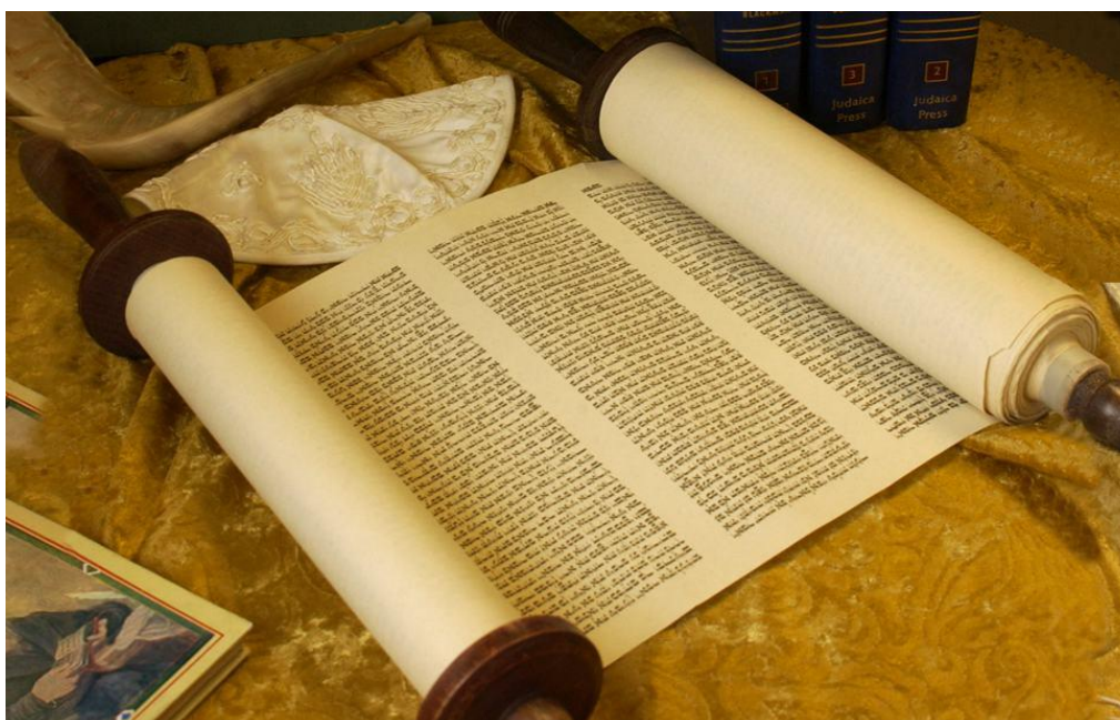
4. ábra: Tóratekeres

Általában sokszor halljuk azt a mondatot, hogy a három nagy monoteista vallás a könyvek vallása . Ez nagy általánosságban azt jelenti, hogy e három nagy vallás az isteni kinyilatkoztatás rögzített, azaz írott könyveit vallásos elragadtatással vallja és követi, ragaszkodik hozzá és a mindennapi életre vonatkozó megfontolásait ezekből származtatja. A zsidó vallás esetében a zsidó Biblia (Tónách/Tanak) jelenti szigorú értelemben a szentírást, amely a közhiedelemmel szemben nem azonos a keresztényi Ószövetséggel. A kereszténység esetében az Ószövetség és az Újszövetség együttesen alkotják a szentírást (bár bizonyos felekezetek esetében itt is vannak eltérések a kanonizációt illetően), míg az iszlám szent könyve a Korán.