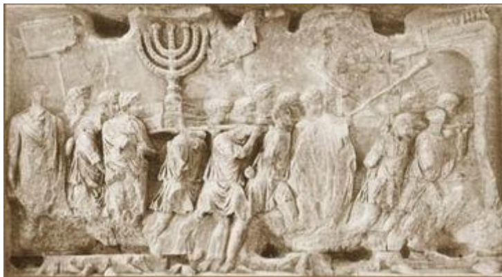
8. ábra: Titus diadalíve (Róma)

Nyílt felkelés 66-ban; Nero Vespasianust, legjobb hadvezérét küldte a forradalom megfékezésére, és Vespasianus lépésről lépésre vette be Galileát. Nero 68-ban meghalt, Vespasianus került a trónra, a hadsereg parancsnoka pedig a császár fia, Titus lett. Véres ostrom több hónapig, majd 70 nyarán a rómaiak betörték Jeruzsálembe és kifosztották és felgyújtották a templomot, Titus pedig dicsőségtől övezve vonult be Rómába.