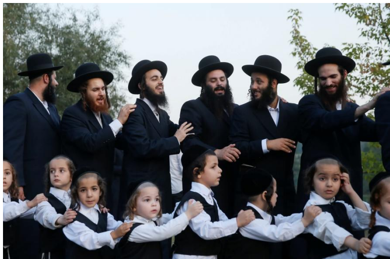
9. ábra: Ultraortodox közösség

Az ortodoxián nem homogén, azaz ezen belül is sokféle irányzat létezik. Pl. a 19. században létrejött német neo-ortodoxia, vagy az amerikai modern ortodoxia (amelyek nyitottabbak a környező világgal), vagy az ultra-ortodoxia irányzatai, amelyek sokkal zártabb csoportban élnek. Ezekben az esetben a modern korra adott válasznak megfelelően alakultak ezek az irányzatok.