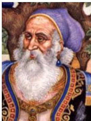
5. ábra: Rabbi Hillél

A zsidó naptárat az előbb említett jellegzetességei miatt luniszoláris (Nap és Hold alapú) naptárnak nevezzük, és jelenleg is használt változatát II. Hillél vezette be a 4. században.