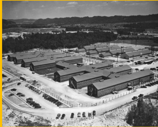
A Manhattan Terv irodaépületei Oak Ridge-ben

Az első projektmenedzsment dokumentáció 1941 körül készült az atombomba fejlesztéséhez a Manhattan Tervben, ami a második világháborúban az atomfegyver létrehozására szerveződött USA, Nagy-Britannia és Kanada részvételével.