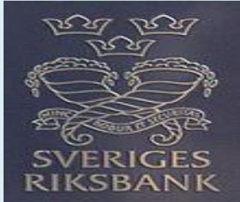
A svéd központi bank logója

Pénztörténet: az aranypénz és a pénzhelyettesítők korszaka