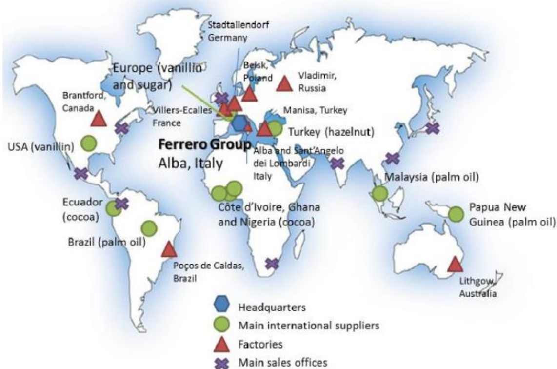
1. ábra A Nutella globális értéklánca

Forrás: De Backer, K. and S. Miroudot (2013), "Mapping Global Value Chains", OECD Trade Policy Papers, No. 159, OECD Publishing, Paris, https://doi.org/10.1787/5k3v1trgnbr4-en