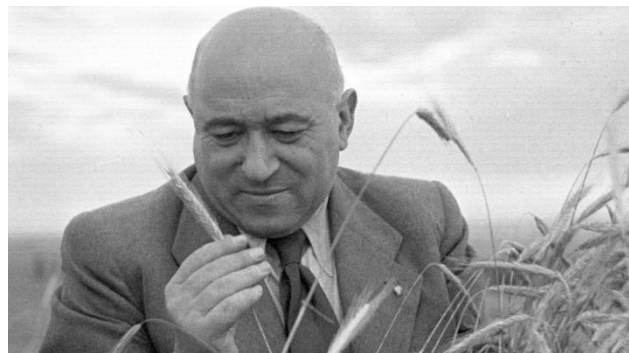
Rákosi Mátyás, a Magyar Dolgozók Pártjának főtitkára 1948 és 1953 között

A párt legfőbb irányító szerve a kongresszus volt, amely a párt politikai irányvonalait határozta meg, valamint megválasztotta a párt vezető szerveit. Két kongresszus között a Központi Vezetőség gyakorolta a hatalmat, amelynek ülési között viszont a Politikai Bizottság. A formálisan a Központi Vezetőség és Politikai Bizottság döntéseinek végrehajtásáért felelős főtitkár , valójában a párt teljhatalmú vezetője volt, így a valós irányítás az ő kezében összpontosult.