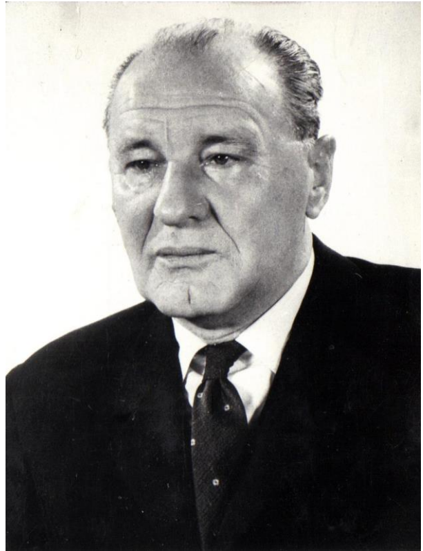
Kádár János a magyarországi szocializmus vezéralakja, a Magyar Szocialista Munkáspárt vezetője 1956 és 1988 között

A közigazgatási szervezet jelentős átalakítására került sor a szocializmus éveiben, ugyanis a korábbi önkormányzati szervek és jogosultságok megszüntetésével centralizált tanácsrendszert hoztak létre a szovjet típusú államigazgatási feladatok ellátására. A helyi tanácsok feladata kizárólag a központ információkkal való ellátása, valamint a központi akarat helyi szintű végrehajtása volt. A tanácsokat, másnéven szovjeteket az 1950:I. törvény hozta létre, amelynek alapján fővárosi, megyei, megyei jogú városi, járási, járási jogú városi és városi tanácsokat alakítottak ki.