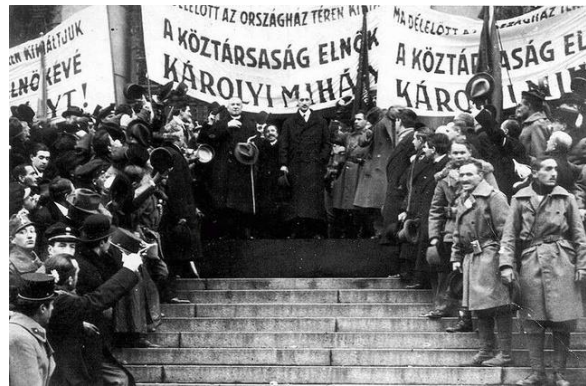
Károlyi Mihály köztársasági elnökké választásának ünneplése

Ezt követően felállt a Nagy Nemzeti Tanács , amely ideiglenes jelleggel törvényhozó hatalomként is funkcionált azon az alapon, hogy a Néphatározat feljogosította néptörvények alkotására. 1918. november 13. és 1919. január 11. között Magyarországnak nem volt államfője. November 13-án jelentette