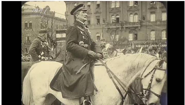
Horthy Miklós emblematikus bevonulása Budapestre 1919-ben

Magyarország ideiglenes államrendezkedéséről szóló 1920:I. tc. rögzíti, hogy Magyarország államfője a kormányzó, s ez határozta meg a kormányzó jogkörét is. A Horthy-korszakban azt a törvényt többször módosították és a módosítások eredményeként fokozatosan bővült a kormányzó jogköre. Az 1920:II. tc.