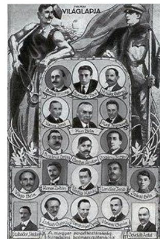
A Forradalmi Kormányzótanács tagjai

Ezzel megindult egy a korábbi alkotmányos fejlődést megakasztó átalakulás, mivel 1919 január végén a szélsőbal kezébe került a hatalom, majd 1919. március 21-én létrejött a Tanácsköztársaság . Ez látszólag demokratikus, valójában azonban diktatórikus államforma volt. Elvileg fenntartották pl. az általános, egyenlő, titkos és közvetlen választójogot, de sokakat kizárnak a választójogból.