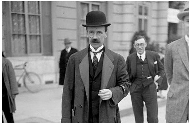
Bethlen István a korszak meghatározó miniszterelnöke