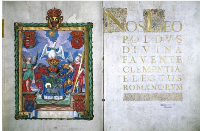
I. Lipót király szabad királyi városi rangot, valamint címerviselési jogot adományoz Debrecen számára (Debrecen, 1693. április 11.)

kifejlődése némileg különbözött a nyugat-európaiktól, mivel nálunk az uralkodók a privilégiumokkal igyekeztek az ígéretes településeket a városi fejlődés irányába elmozdítani. Több privilegizált település lesüllyedt, míg egyes gazdaságilag megerősödött helység nem kapott elismerést. Esztergomnak és Székesfehérvárnak különleges helyzete volt Magyarországon.