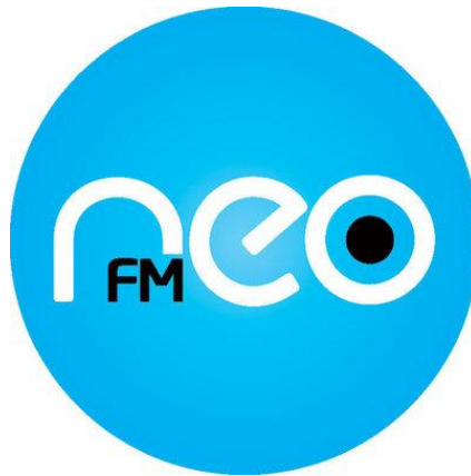
1. kép: A Neo FM logója 2

A Neo FM 2009. november 19-én kezdte el a műsorszolgáltatást, miután sajátos módon nyerték el a korábban a Sláger Rádió által használt frekvenciát. 2008. december 18-án az Országgyűlés úgy módosította a médiatörvényt, hogy az ORTT pályáztatás nélkül is meghosszabbítható volna az akkor működő Sláger és Danubius Rádiók további működését. 1 Sólyom László, akkori köztársasági elnök azonban előzetes normakontrollra küldte a módosított jogszabályt, mivel úgy vélte, a módosítás korlátozza a gazdasági versenyt.