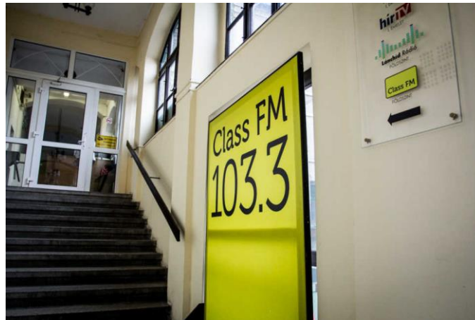
3. kép: A Class FM logója 24

A Class Fm 21 2009. november 19-én kezdte el a műsorszolgáltatást. Tulajdonosi köre a korábbi Danubius Rádió frekvenciáját elnyerve indította el a másik országos lefedettségű, földi sugárzású adót. Az Advenio Zrt. által működtetett csatorna tulajdonosi köréhez tartozott a Heti Válasz, a Magyar Nemzet és a Lánchíd Rádió is, mely túlzott médiapiaci jelenlétet eredményezett, így ezt fel kellett számolni. A csatorna rövid idő alatt az ország egyik leghallgatottabb adójává vált. Különösen a Sebestyén Balázs vezette Morning Show-nak köszönhetően. 22 Az Advenio Zrt. többségi tulajdona 2013 nyarán kerül Simicska Lajoshoz. A csatorna anyagi biztonságához jelentősen hozzájárulnak az állami vállalatok hirdetése. 23