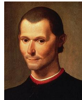
Niccolo Machiavelli Santi di Tito festménye 16. század 2. fele Firenze, Palazzo Vecchio

Újkor és modernitás: A politikai autoritás legitimációja a társadalmi szerződés en alapul.