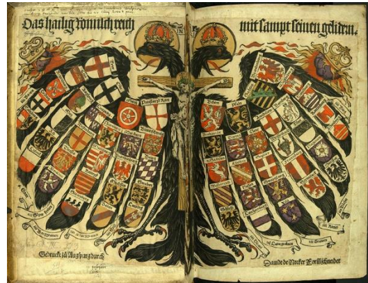
A Szent Római Birodalom címere Jost de Negker fametszete (1510)