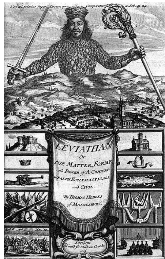
Hobbes Leviathan című művének címlapja az 1651-es első kiadáson

Hobbes ezzel szemben tagadta bármiféle természetes-objektív morális érték adottságát – miközben Grotiusszal együtt úgy vélte, hogy a kései reneszánsz szkeptikus meggyőződésével szemben lehetséges elméletet adni a politikáról. Az ember bármilyen eszközt igénybe vehet önfenntartása érdekében: a természetes állapotban az embert nem jellemzi semmiféle szociabilitás, mely kordában tarthatná azt. Maga az önfenntartás sem objektív-természetes érték, hanem a vele asszociált ius in omnia (mindenhez való jog) eszméjében pontosan a természetes értékek destrukciója fejeződik ki. A mindenki háborúja mindenki ellen e messzemenően kompetitív víziója olyannyira radikális, hogy ez csak egy mesterséges mechanizmus megalkotásával haladható meg, mely teljesen mértékben konstruktivista közösség-konceptiót eredményez. Mivel minden jog és morális érték az individuumok szerződésén alapul, valamint mivel az individuumoknak teljesen le kell mondaniuk saját önnfenntartásuk jogáról a szerződés során, ezért a konstituált politikai szuverén abszolút politikai hatalommal fog rendelkezni a társadalomban. A hobbesi