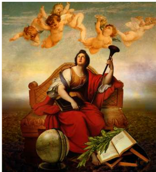
Klió, a történetírás múzsája

„Kronológiai áttekintést ad az irodalom körébe tartozó jelenségekről, a hagyományozott szövegekről, irányzatokról, szerzőkről, művekről, műfajokról, ill. az egyes nemzeti irodalmak egymás közti recepciójáról, egymásra gyakorolt hatásáról (összehasonlító irodalomtudomány), s összefüggéseiben értelmezi azokat.”