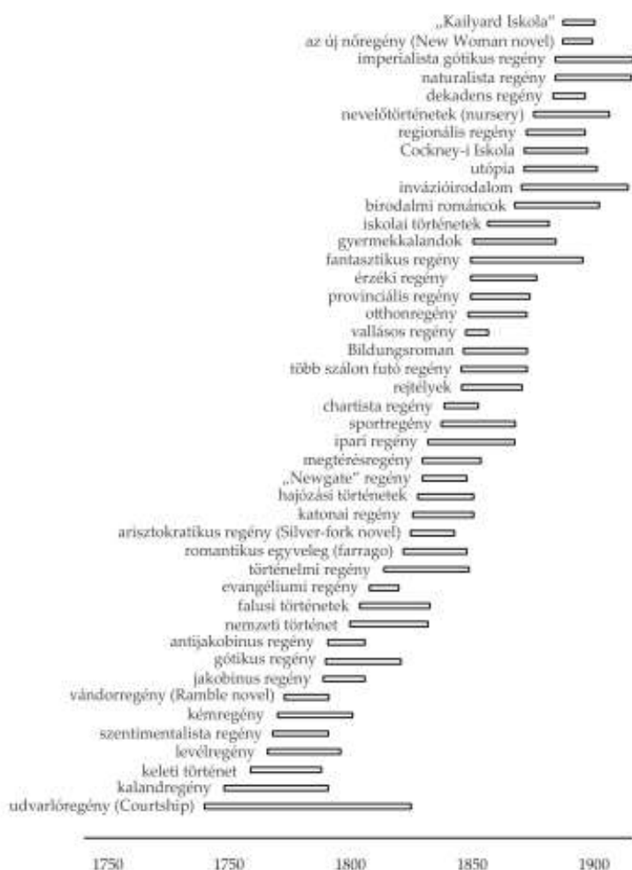
9. ÁBRA: A brit regényműfajok, 1740-1900

Forrás: http://epa.oszk.hu/03500/03580/00008/pdf/