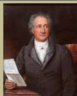
Johann Wolfgang von Goethe.

Feladat: Oldja meg az alábbi feladatot Arisztotelész Poétikájáról :