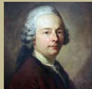
Charles Batteux

Központi elv: Úgy véli, hogy univerzális és időtlen költői kifejezési módok léteznek. Ezeket a költészet természeti formáinak nevezi. Az egyes műfajok a természeti formák kombinációi.